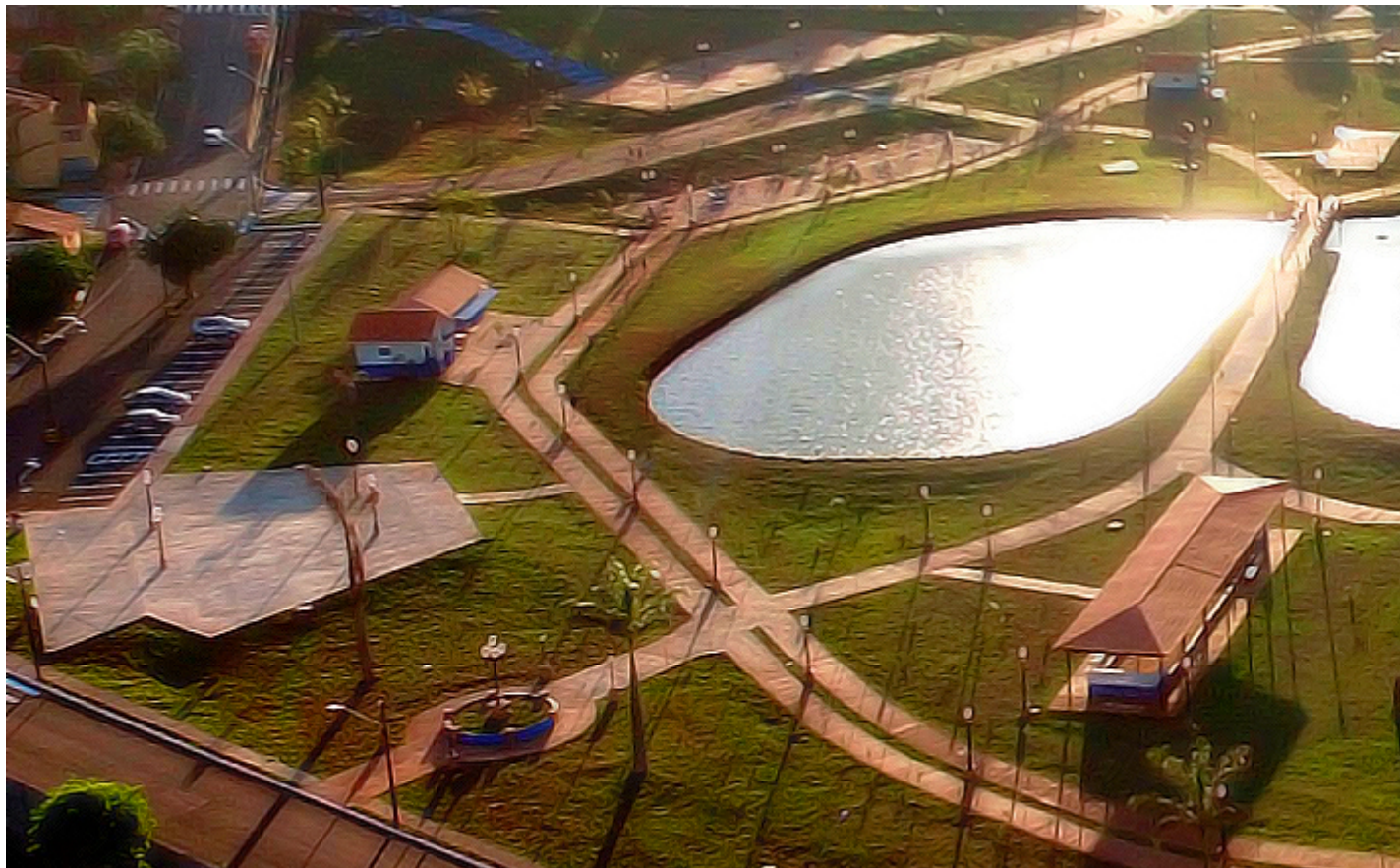
Parque do Povo