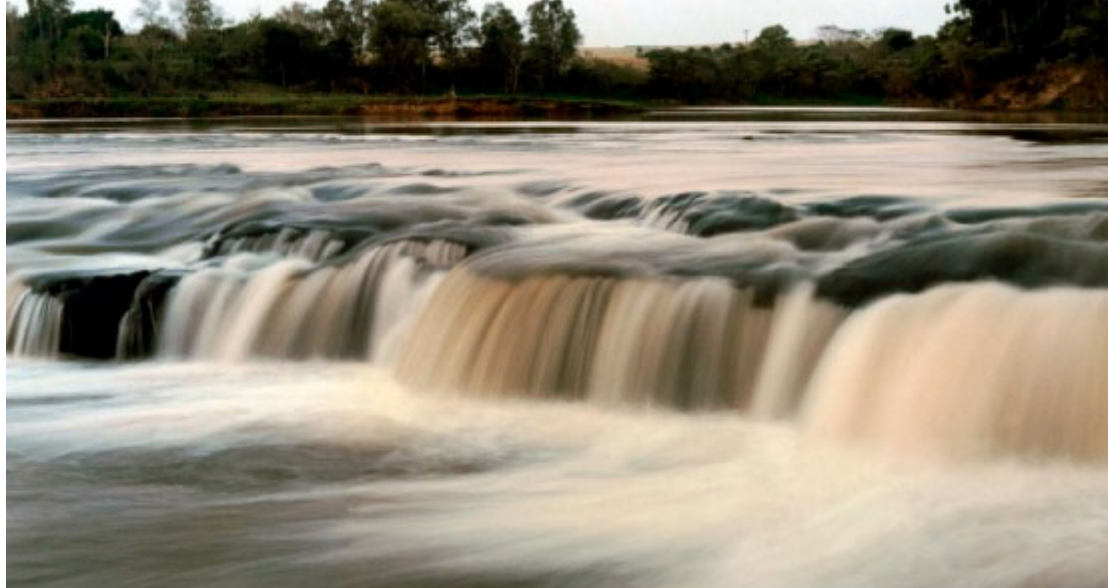
Encontro das Águas