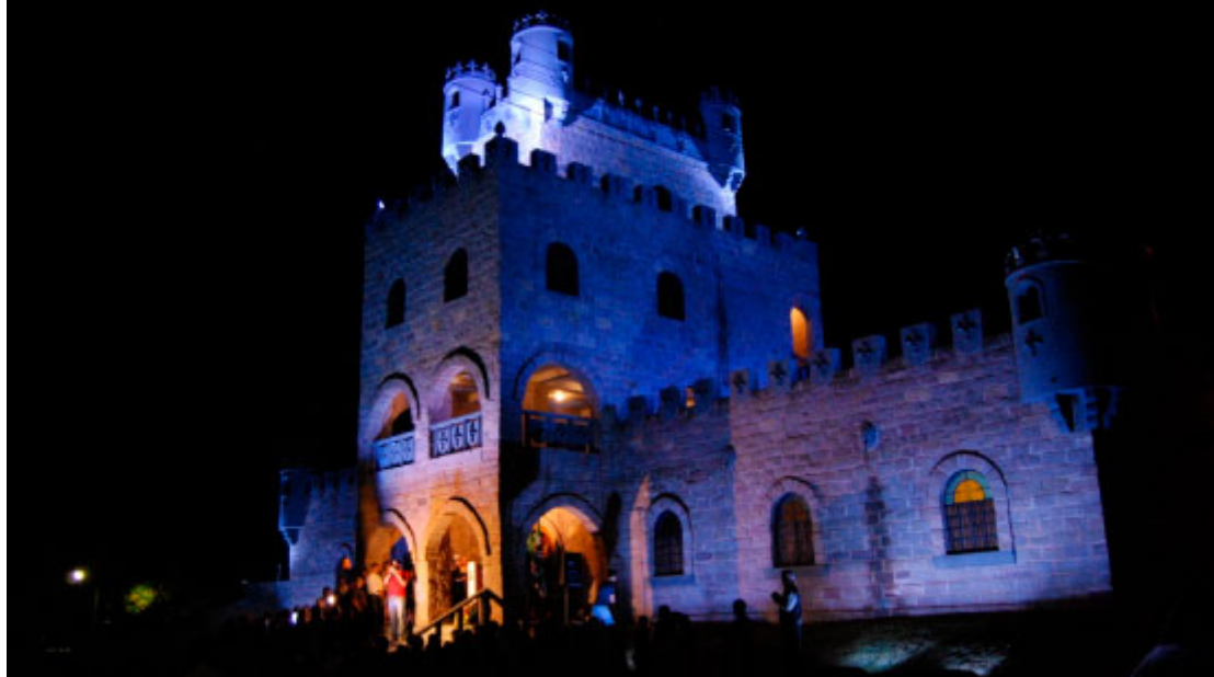
Castelo La Dorni