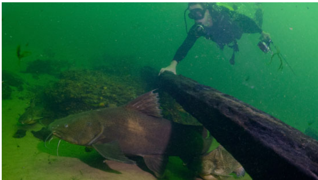
Mergulho no Rio Paraná