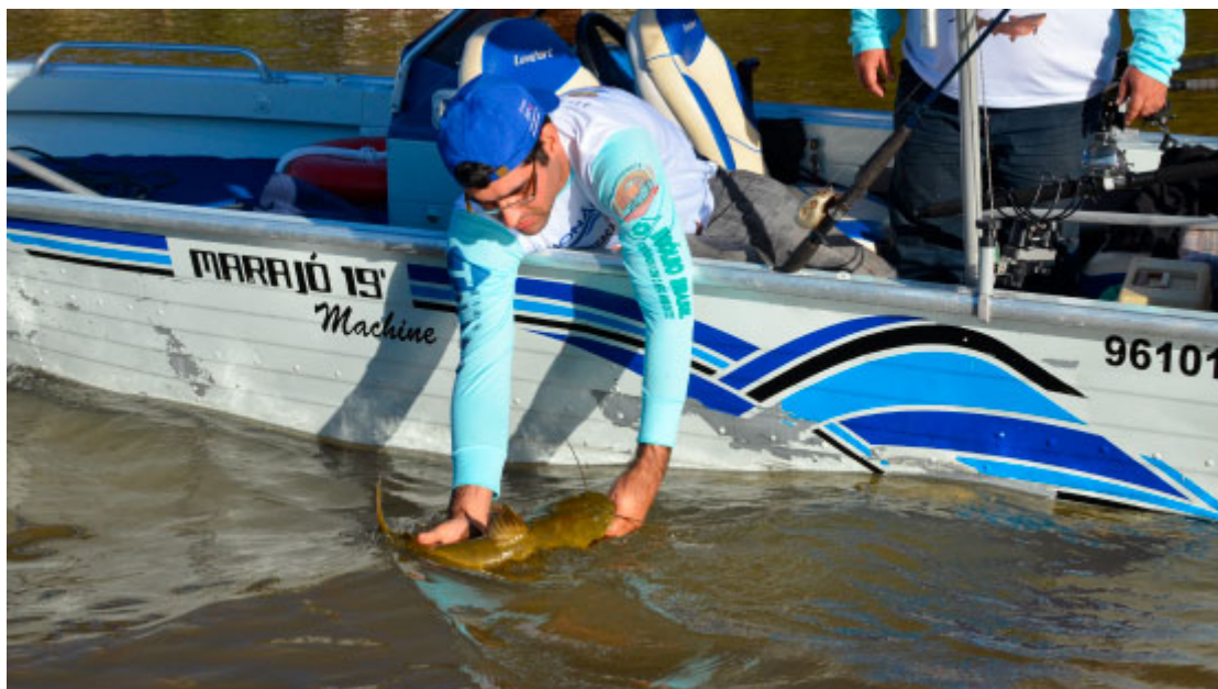
Pesca no Rio Paraná

O Fundão, como o próprio nome sugere, é um dos locais mais profundos do rio Paraná, excelente para pesca ou mergulho, com uma grande diversidade e quantidade de cardumes das mais variadas espécies de peixes. O local concentra pescadores e mergulhadores de todo o Brasil.