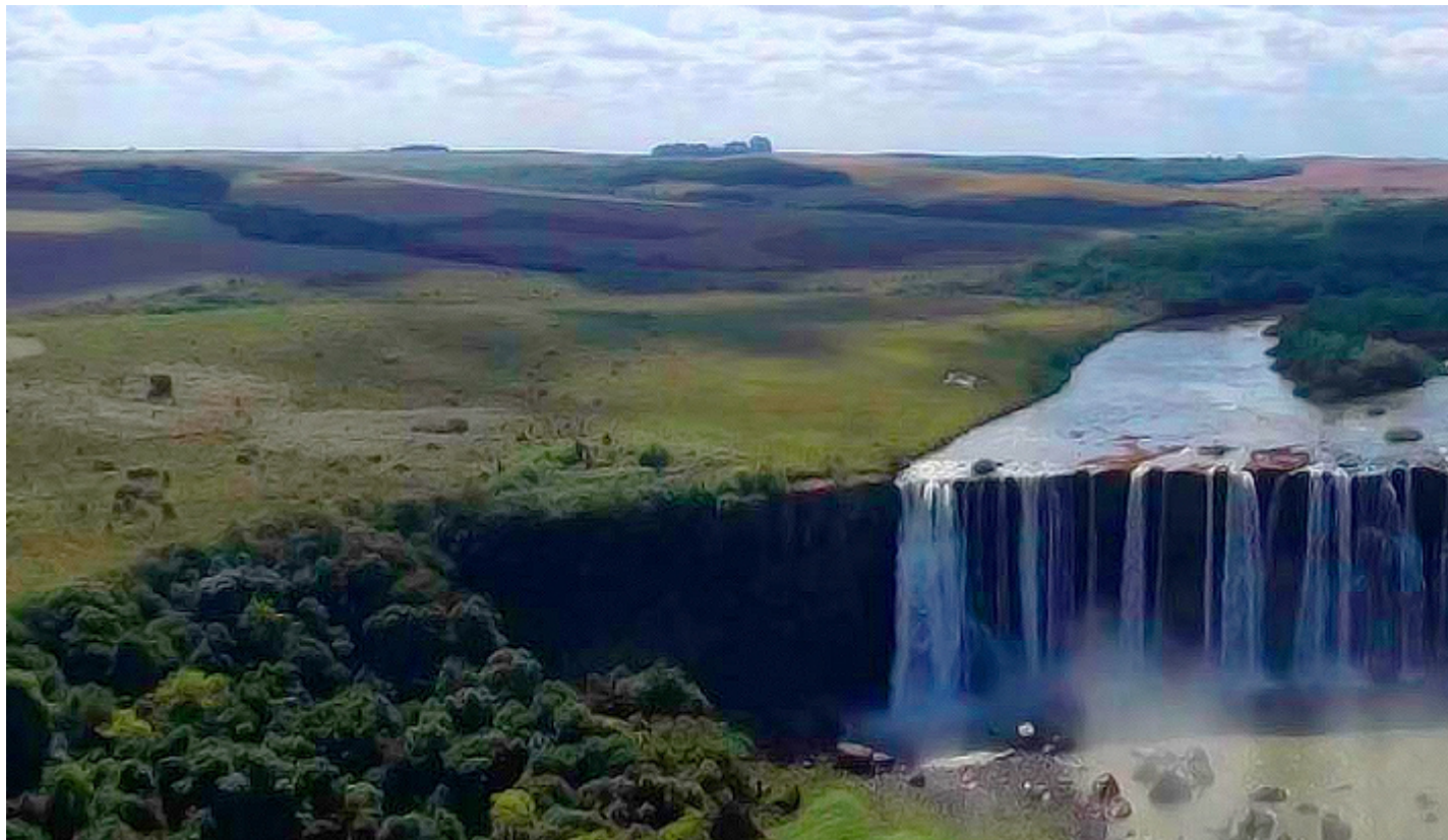
Salto Curucaca