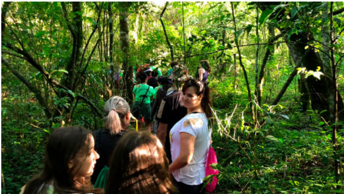
Caminhada da Natureza