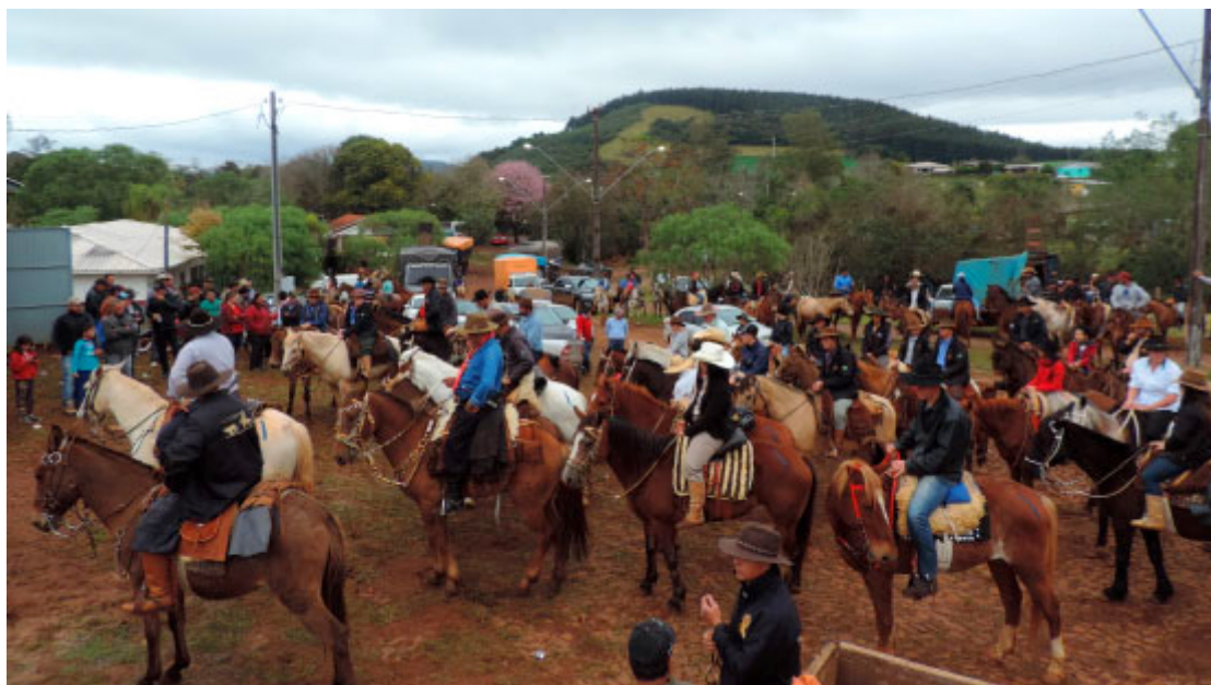
Cavalgada da Integração