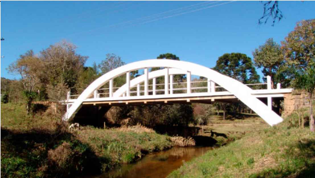
Ponte do Arco - Foto: Prefeitura de Quatro Barras

Aberto de segunda a sexta, das 8h às 17h, o Centro de Informações Turísticas orienta os visitantes sobre as opções de hotelaria, gastronomia e serviços da cidade. Folders apresentam os principais pontos turísticos a visitar