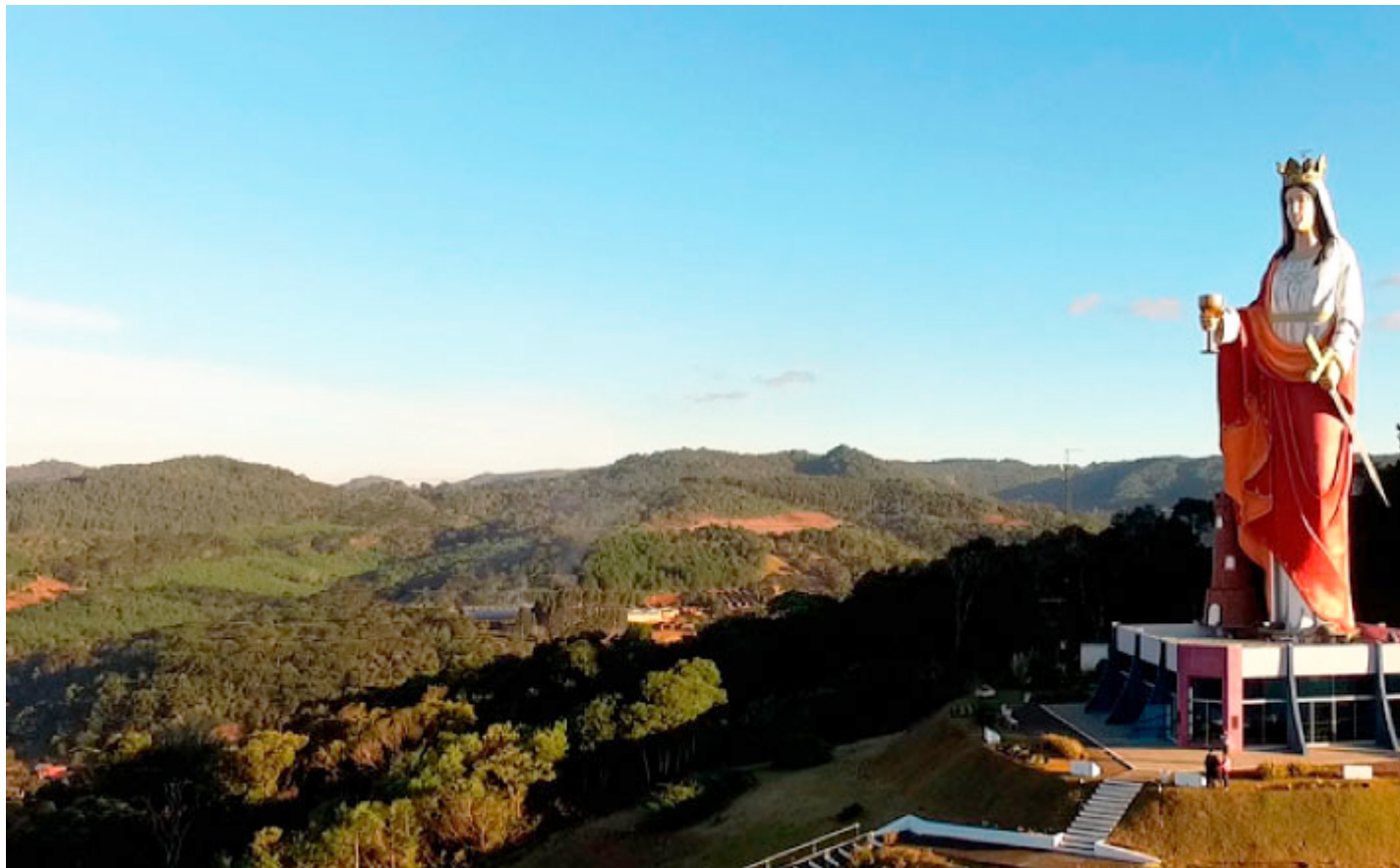
Estátua de Santa Bárbara