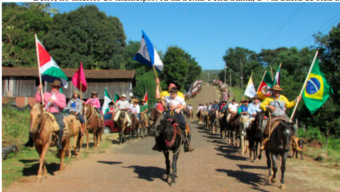
Cavalgada de Santa Emília de Rodat

Em abril, acontece a Cavalgada de Santa Emília de Rodat. O evento reúne centenas de tradicionalistas que cavalgam por cerca de 300 km até o Santuário, no Distrito de Siqueira Bello, no interior do município. Já na Sexta-Feira Santa, a Via Sacra de Rua atrai milhares de