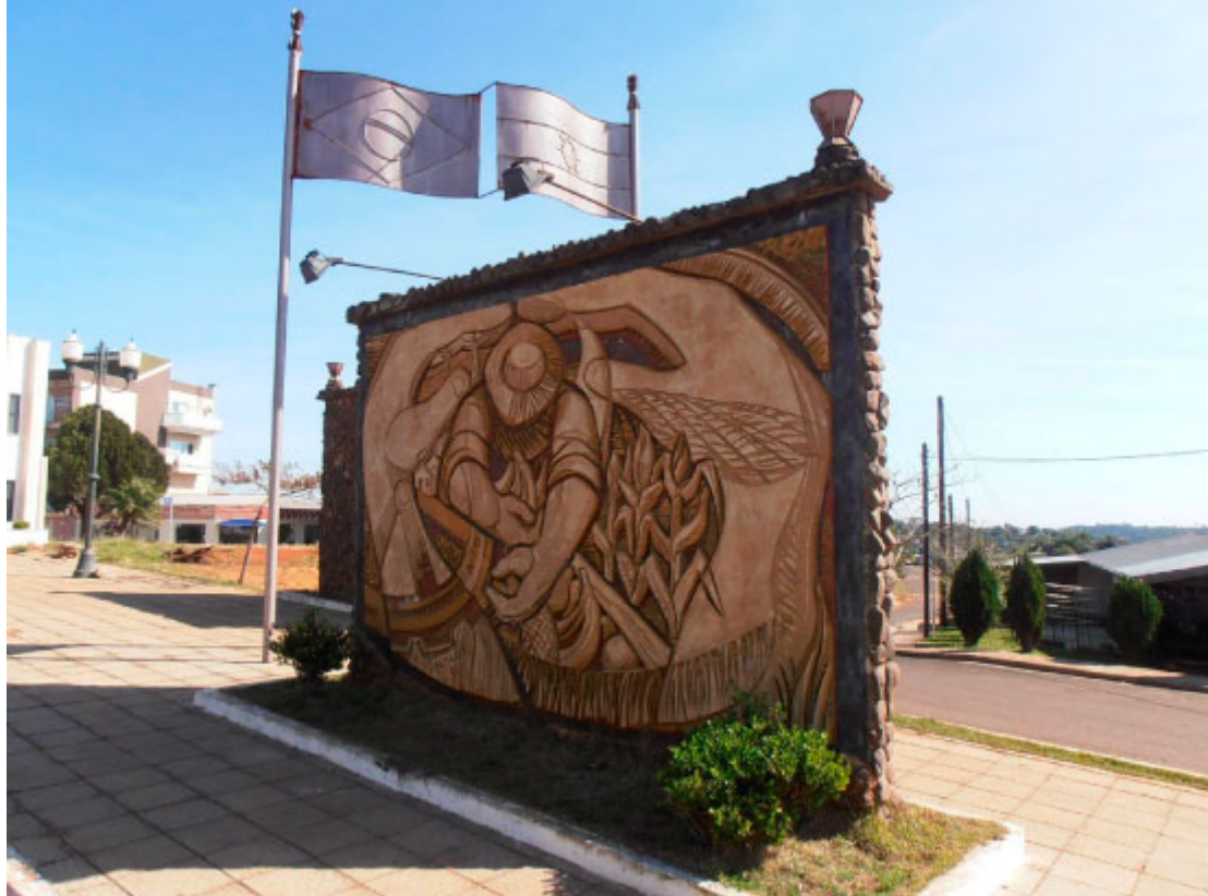
Marco das Três Fronteiras