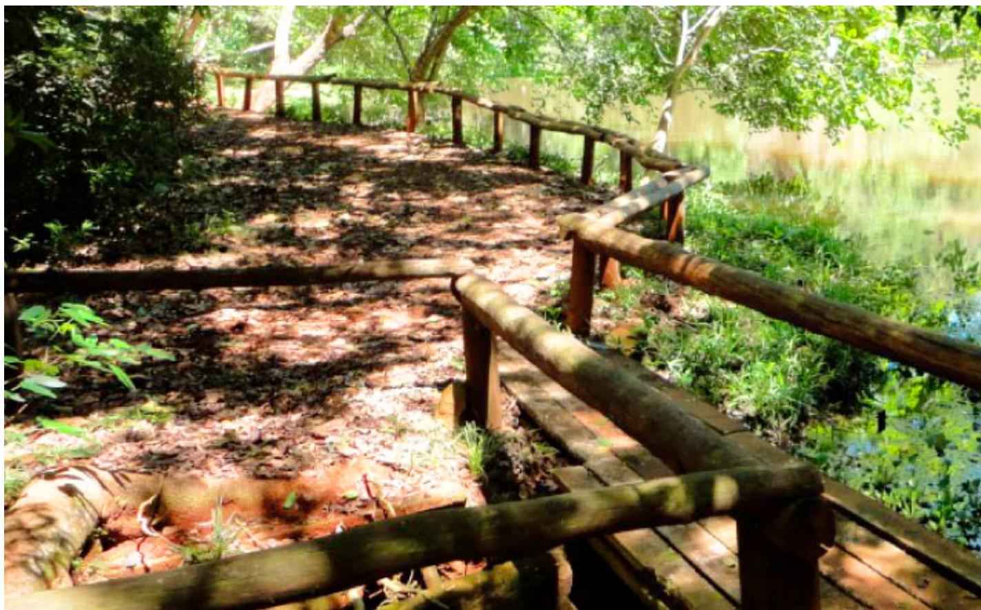
Parque Estadual Vila Rica do Espírito Santo