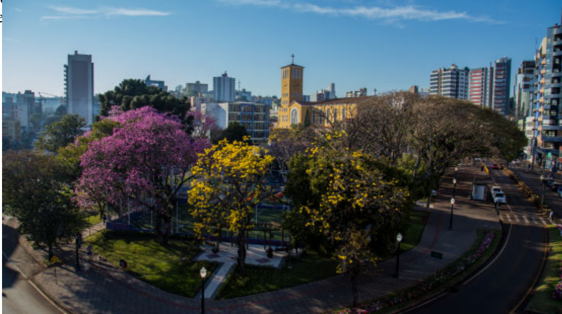
Praça Presidente Vargas - Foto: Rodinei Santos / Departamento de Imprensa Prefeitura de Patos Branco

exemplo dessas inovações é a Árvore Tecnológica instalada na Praça Presidente Vargas, que fornece gratuitamente sinal de wi-fi e serve como ponto de recarga para celulares. Assim, compartilhar as belezas da cidade