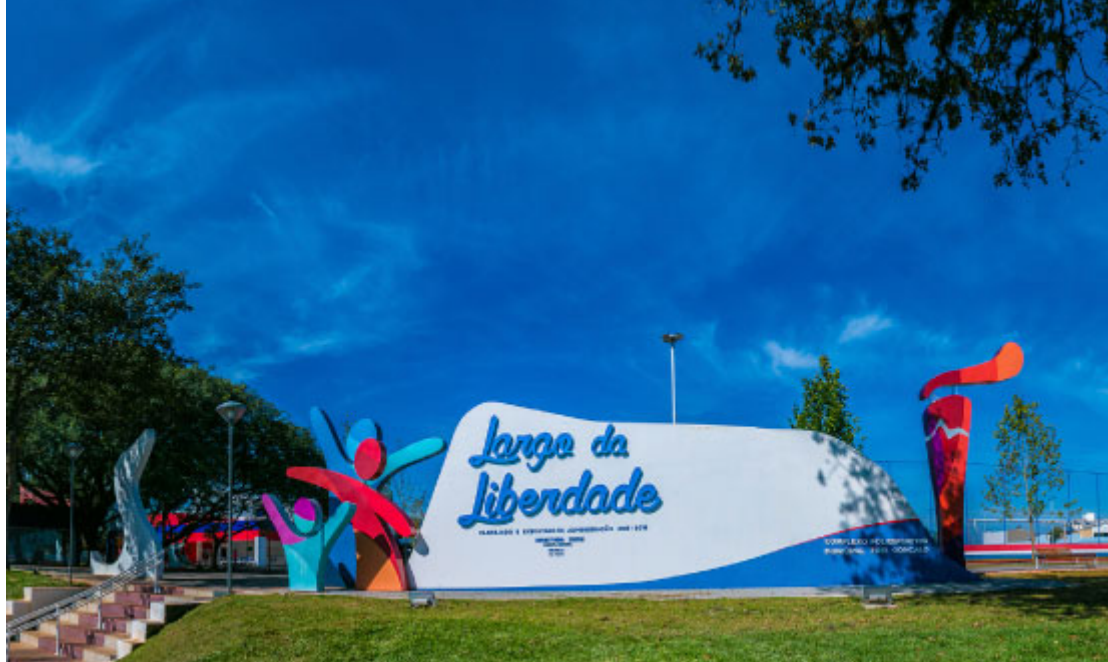
Largo da Liberdade