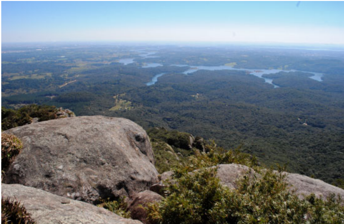
Vista do Morro do Canal - Foto: Bruno Oliveira / Prefeitura de Piraquara

Piraquara possui ainda inúmeros locais para a prática de turismo de aventura, turismo rural e ecológico, além do cicloturismo que compõem o calendário de atividades turísticas ao longo do ano.