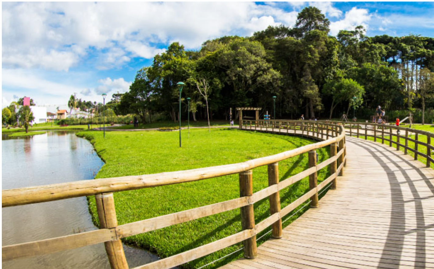
Parque das Águas