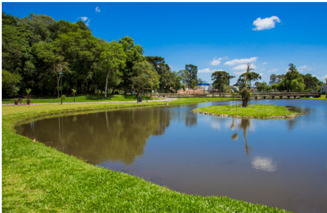
Parque das Águas

O calendário de eventos locais conta diversas atrações! Dentre elas, os frequentes eventos culturais no Parque das Águas, e também, a tradicional Festa Trentina. Há um vasto calendário de festas religiosas, como a Festa do Padroeiro Bom Jesus dos Passos, Carreata de São Cristóvão e Caminhadas Penitenciais. Opções não faltam! É só escolher as de sua preferência e aproveitar.