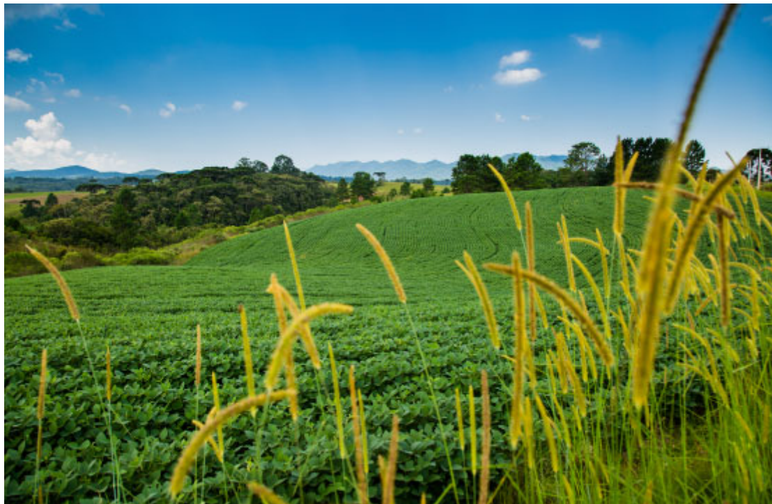
Área Rural 1 - Foto: Bruno Oliveira / Prefeitura de Piraquara

Para quem gosta de turismo rural e se interessa pelas marcas da cultura italiana, o Caminho Trentino dos Mananciais da Serra é um belo passeio. É uma oportunidade para desfrutar da natureza e ainda aproveitar as delícias da comida típica trentina.