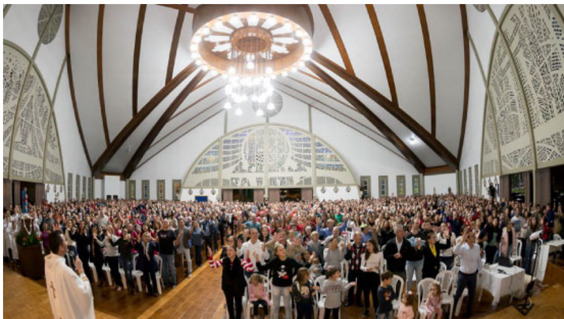
Igreja Matriz