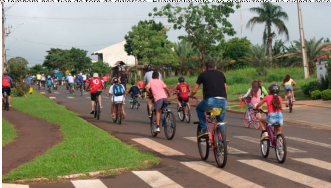
Passeio Ciclístico

Os bailes de salão são tradicionais nas comunidades de Medianeira, mas o turista que prefere atividades ao ar livre também não fica de fora de diversão. Eventualmente são organizados na cidade passeios na natureza, como