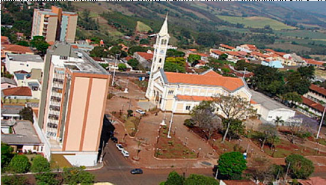
Praça da Igreja Matriz - Foto: Prefeitura de Jandaia do Sul

Com belas e importantes igrejas — como a Matriz e Dico de Amor e a Igreja do Km 8 — e a realização de peregrinações, a cidade oferece um rico patrimônio religioso.