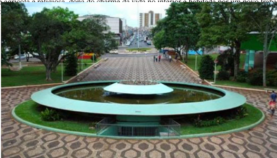
Praça do Café

No caminho do crescimento, destacam-se a localização privilegiada, sobre o principal tronco rodoferroviário do Norte do Paraná, e as condições do solo seco que atraiu agricultores vindos de todas as regiões do país para o cultivo do café. Esses fatores foram fundamentais para as feições da Jandaia do Sul de hoje: uma cidade agrícola e religiosa, dona do charme da vida no interior e habitada por um povo trabalhador e hospit