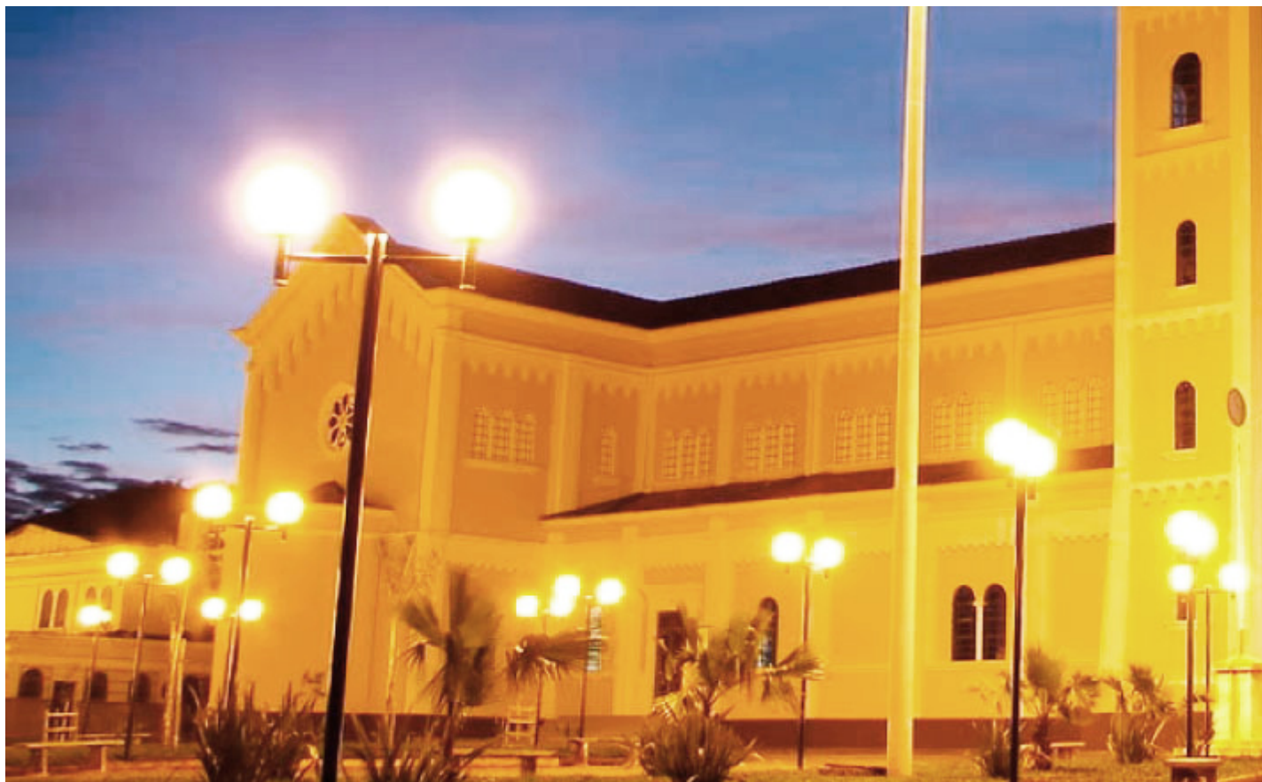
Igreja Matriz