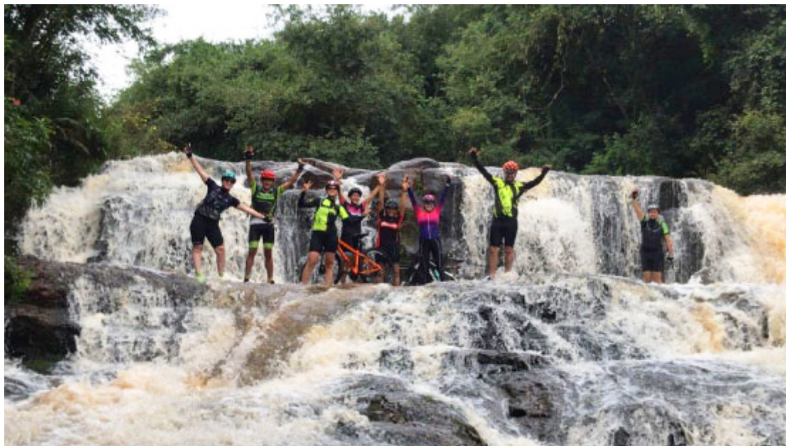
Cachoeira Rio Sem Passo - Foto: Prefeitura de Luiziana