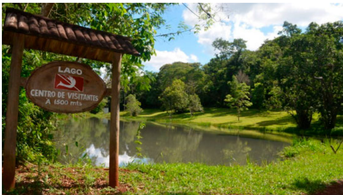
Parque Estadual Lago Azul

Mantida em parceria com Campo Mourão, o Parque Estadual Lago Azul tem como afluentes os rios de Luiziana, além das águas represadas pela Usina Mourão. O local recebe diariamente centenas de visitantes e oferece duas opções de trilhas, a Peroba e a Aventura. O segundo trajeto precisa de mais atenção na caminhada, por isso, é necessário contratar um guia.