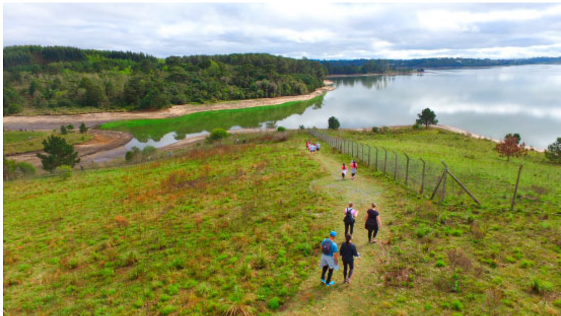
Caminhada Ecológica