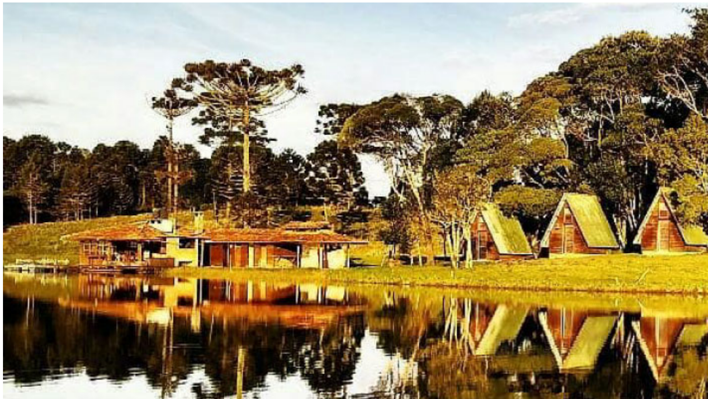
Lago Kuriukaka