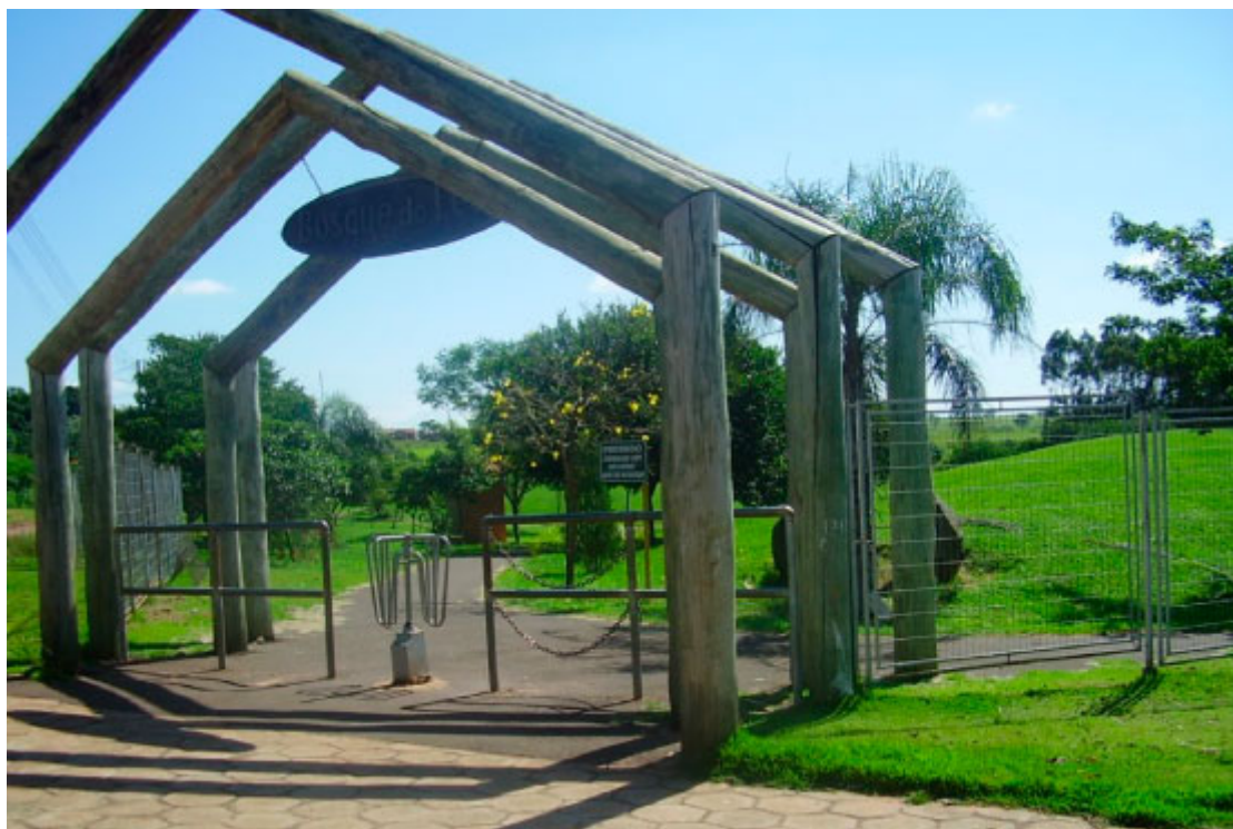
Bosque do Leão