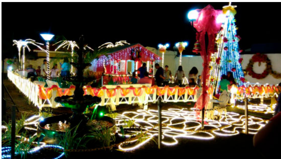
Casa do Papai Noel - Foto: Silvano Santos / Prefeitura de Cidade Gaúcha