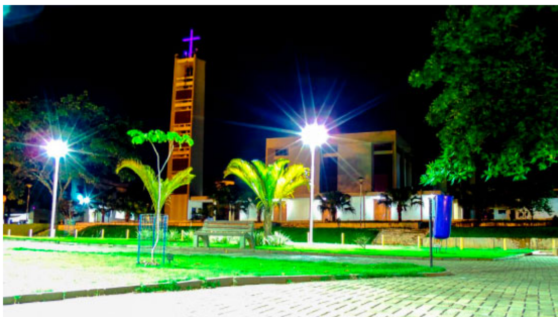
Praça da Igreja Matriz