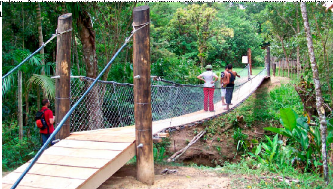
Salto Parati

Curtiu a ideia dos jogos e quer mais aventura? Agende uma visita ao Salto Parati e descubra a piscina natural de 2 metros de profundidade. A chegada ao local inclui travessia de barco e trilha de 15 a 30 minutos pela mata nativa. No trajeto, você pode encontrar várias espécies de pássaros, animais silvestres e a flora da Mata Atlântica.