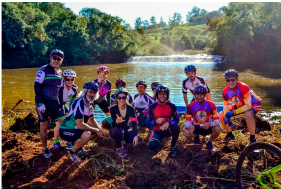
Saltinho (Rio São Francisco Falso) - Foto: Prefeitura de Diamante D'Oeste