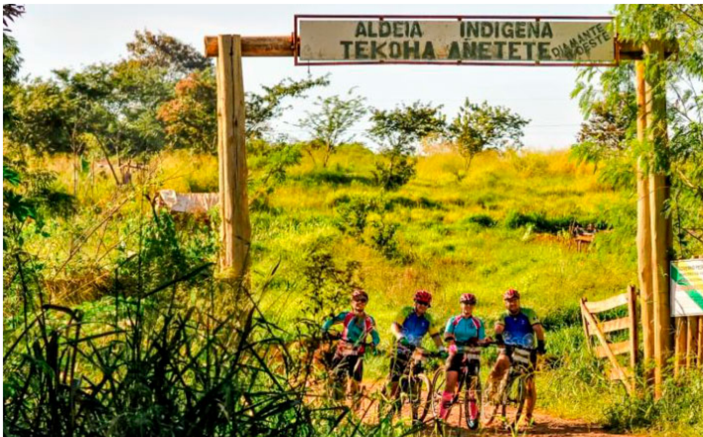
Aldeia Indígena Tekoha Anette - Foto: Prefeitura de Diamante D'Oeste