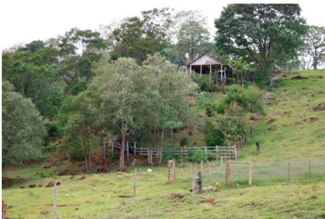
Comunidade Manto Sagrado