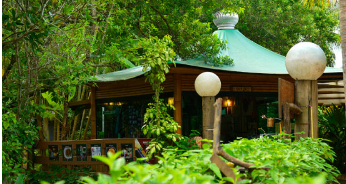
Praça de Alimentação