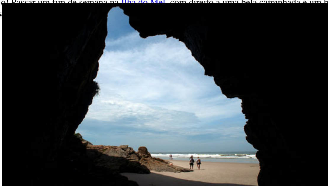
Gruta das Encantadas

É obvio que esse lugar repleto de coisas incríveis só poderia oferecer uma coisa: bateria cheia. É isso mesmo! Passar um fim de semana na Ilha do Mel , com direito a uma bela caminhada e um banho de mar, faz você voltar mais energizado e feliz, não é? Paranáense?