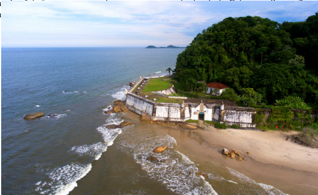
Fortaleza Nossa Senhora dos Prazeres

A ilha é dividida em duas vilas, Nova Brasília e Encantadas. Para quem quer curtir restaurantes, barzinhos e baladinhas a dica é ir para Nova Brasília. Além disso, essa vila fica mais perto das praias do Farol das Conchas e da Fortaleza Nossa Senhora dos Prazeres. Mas quem quiser sossego deve escolher ficar em Encan Gruta das Encan