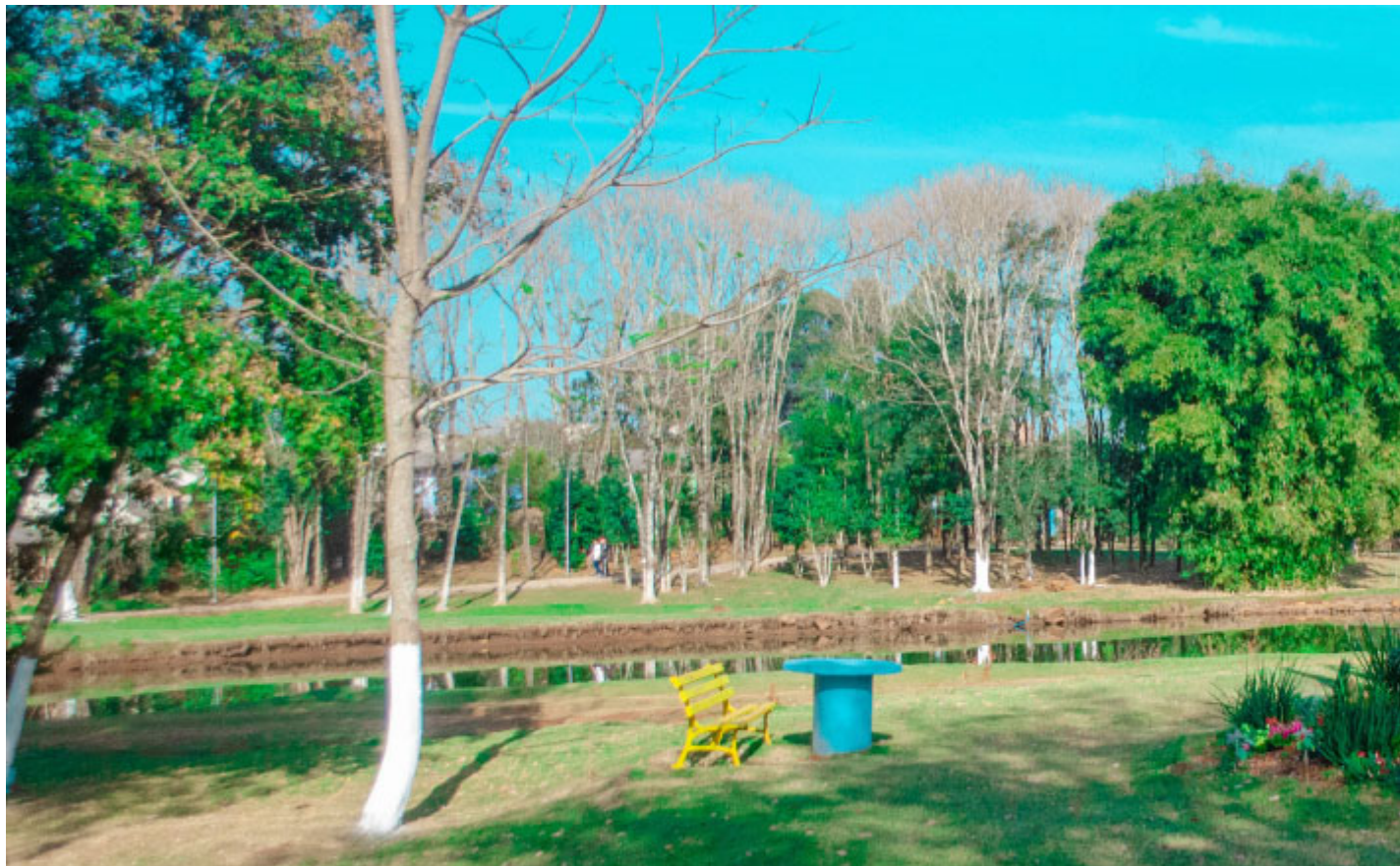
Parque Ambiental Fundo de Vale