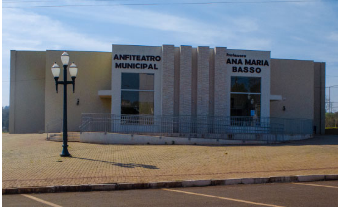
Anfiteatro Municipal Professora Ana Maria Basso