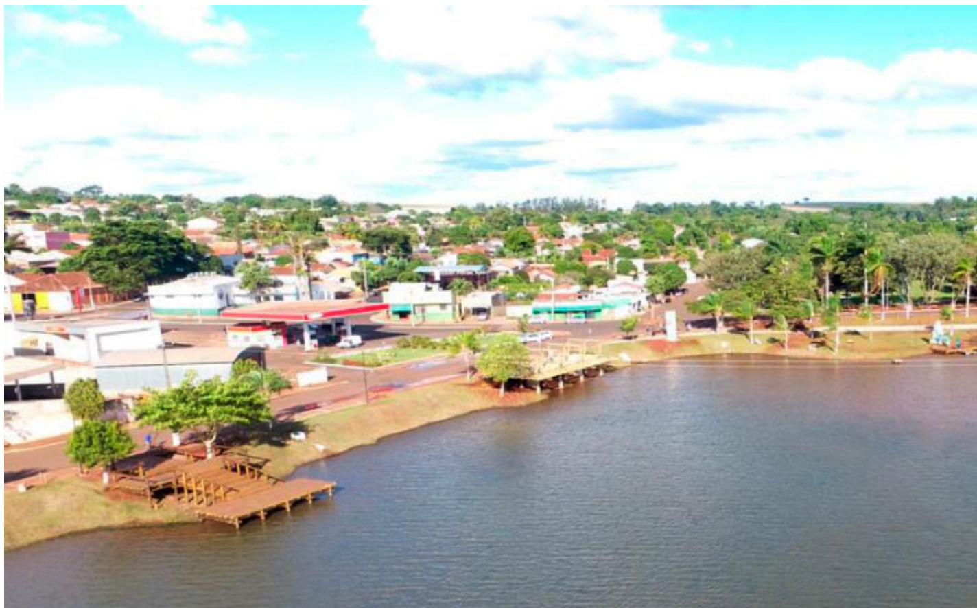
Lago dos Patos