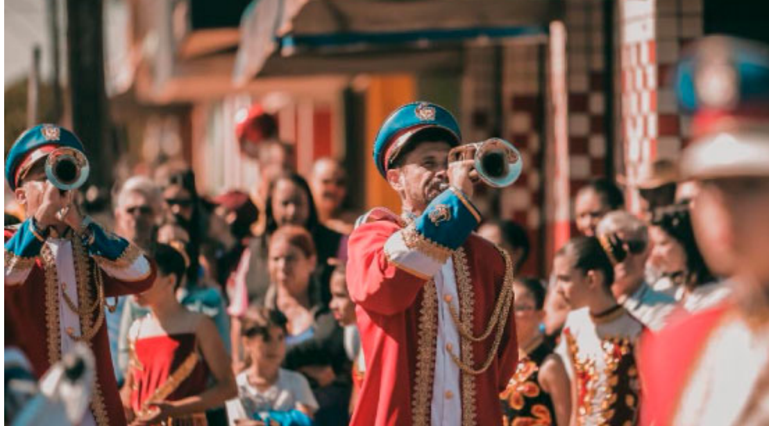
Fanfarra Municipal