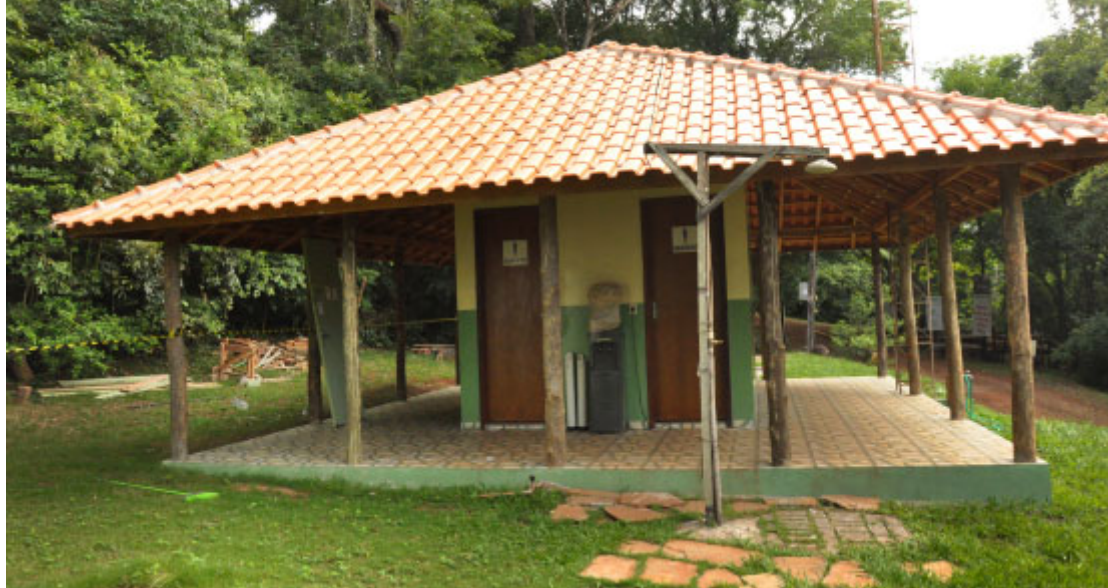
Parque Ibicatu