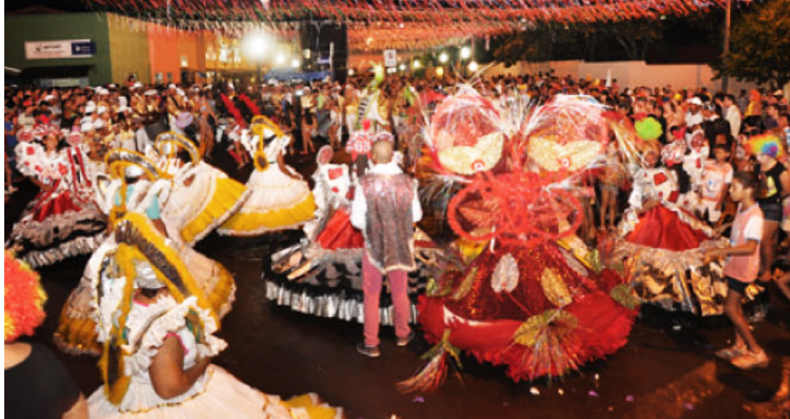
Carnaval de Rua