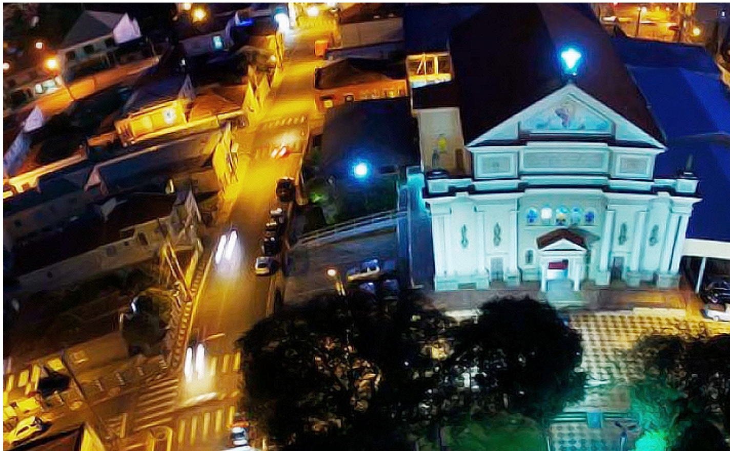
Igreja Matriz