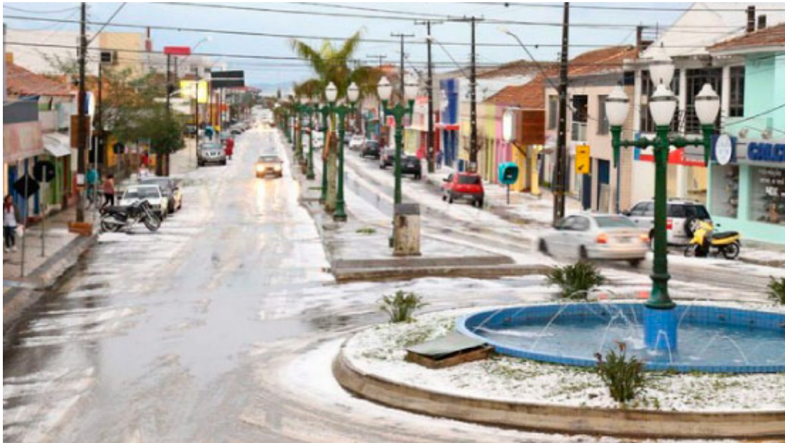
Avenida Sete de Setembro