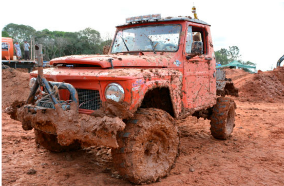
Encontro Off Road - Foto: Ivone Kleiner Rocha / Prefeitura de Imbituva