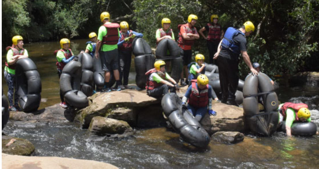
Boia Cross - Foto: Toninho Anhaia / Prefeitura de Piraí do Sul