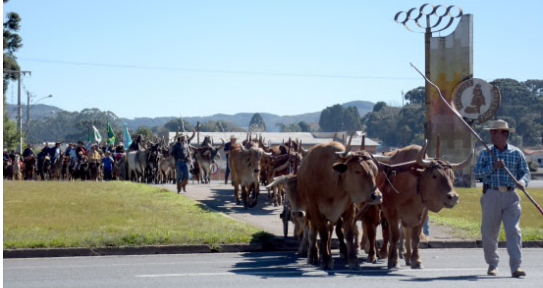
Encontro dos Tropeiros