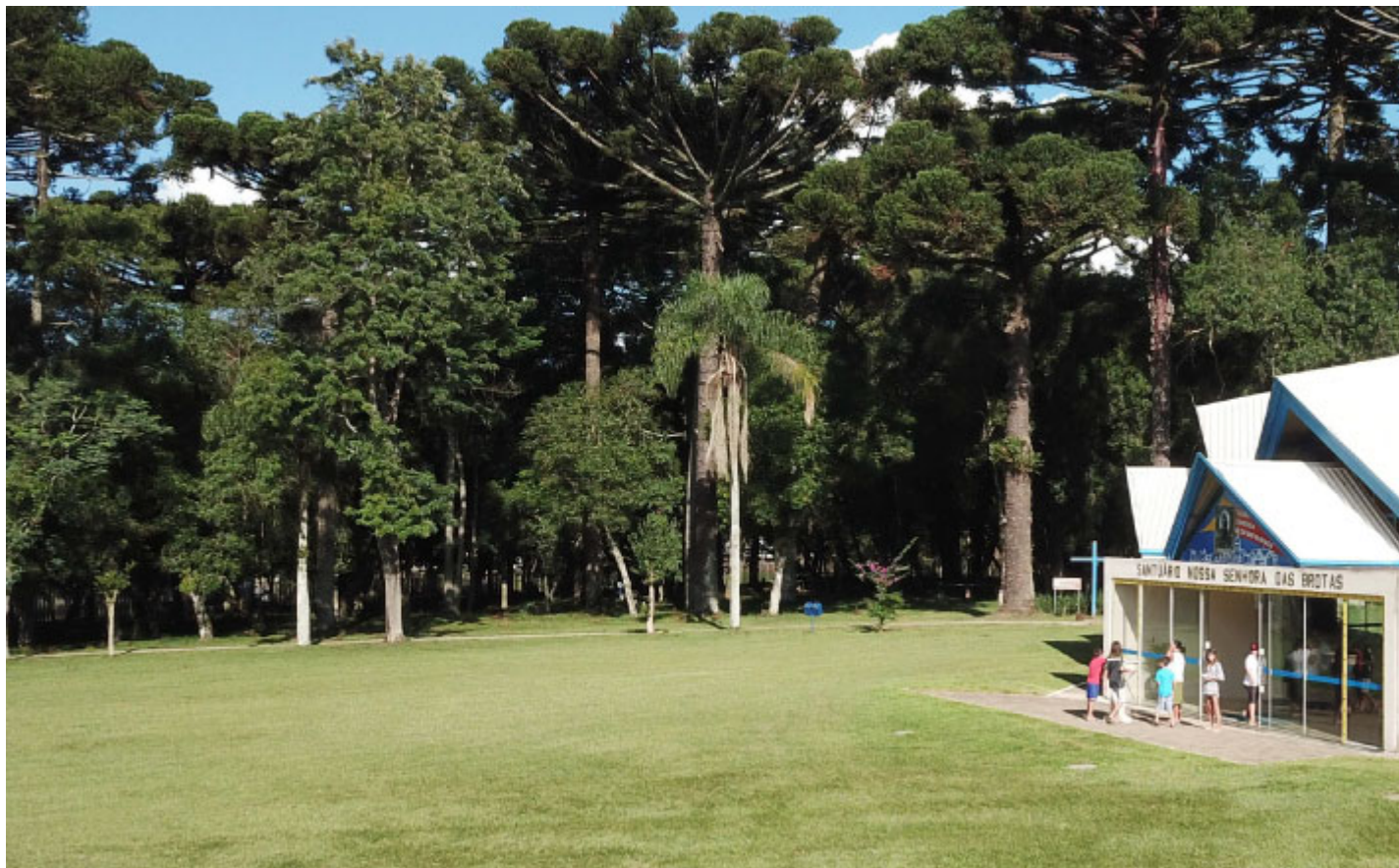
Santuário Nossa Senhora das Brotas