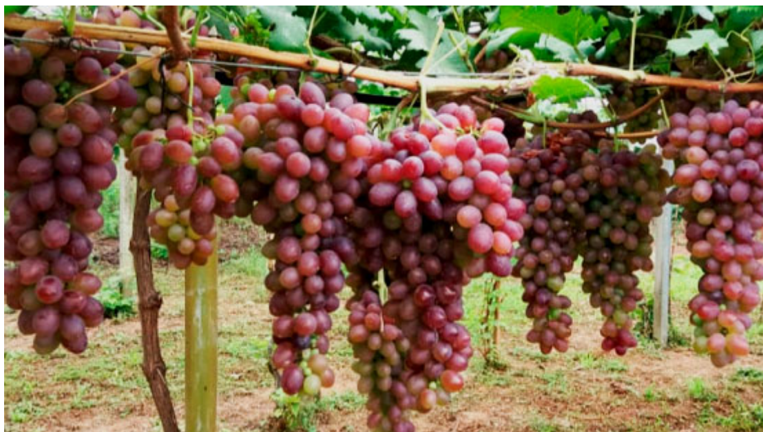
Vinícola São Francisco de Salles