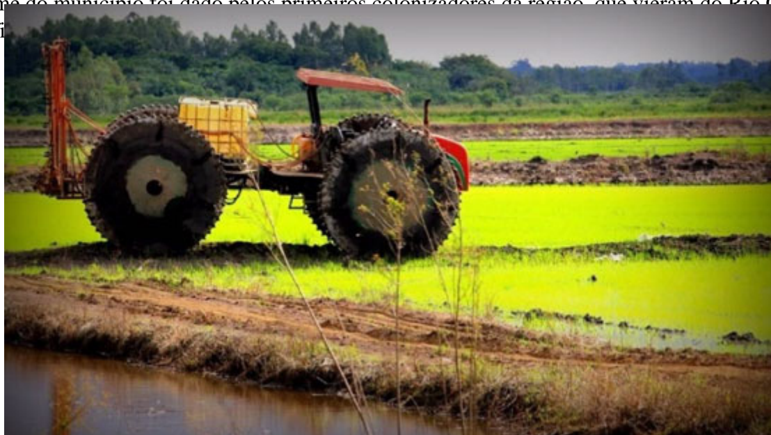
Arroz Irrigado - Foto: Claudiney Nery

O nome do município foi dado pelos primeiros colonizadores da região, que vieram do Rio Grande do Sul, e signifi