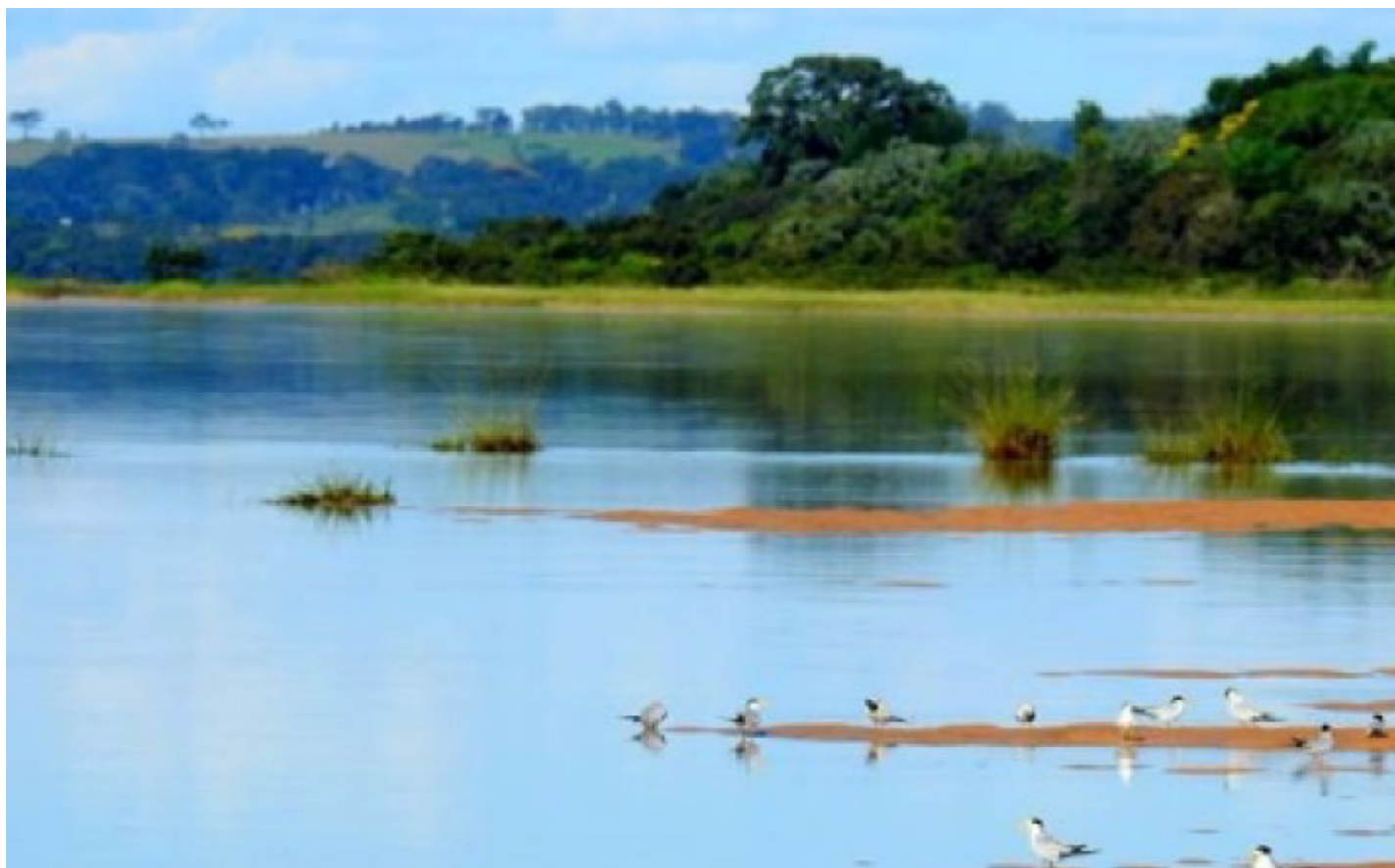
Pantanal Paranaense