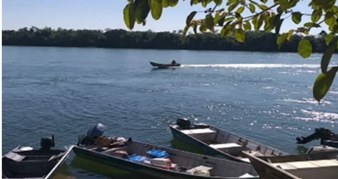
Portos da Cordialidade