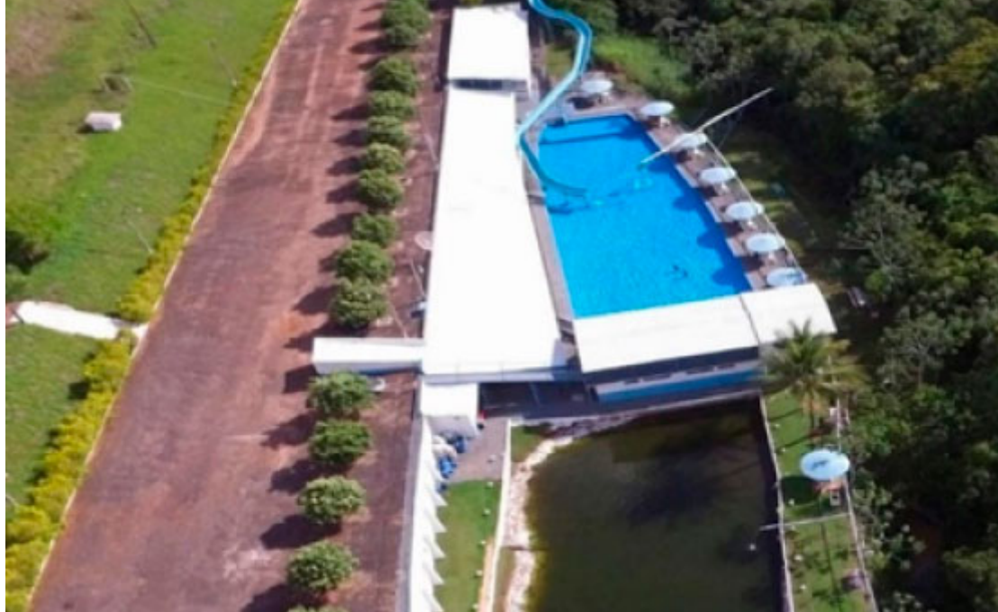
Balneário Rancho Arara Azul