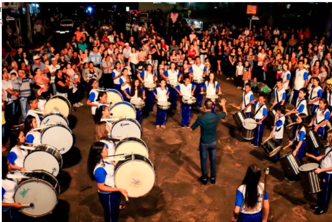
Apresentação da fanfarra do município no aniversário da cidade