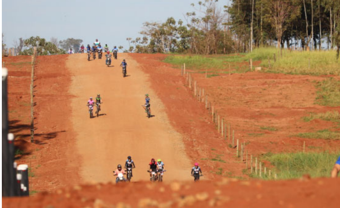
Circuito Internacional Vou de Bike - Foto: Assessoria de Comunicação / Prefeitura de Pérola