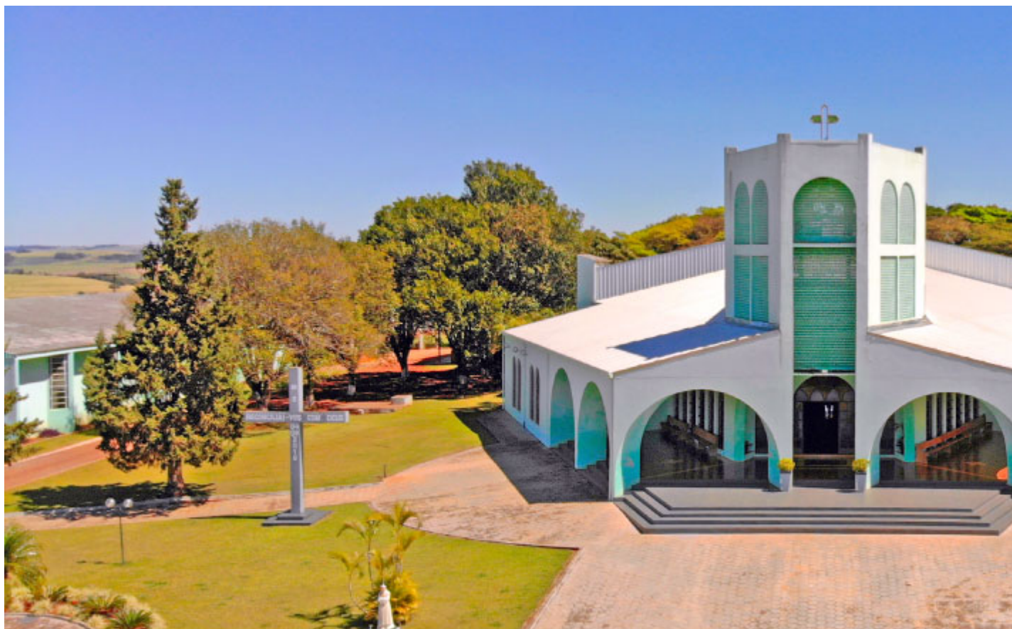
Santuário Nossa Senhora da Salette