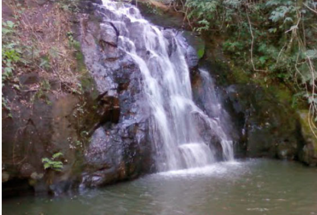
Cachoeira Rio das Antas