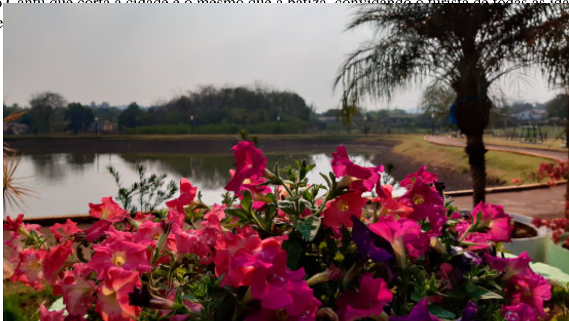
Lago Municipal - Foto: Prefeitura de Nova Cantu

O Rio Cantu que corta a cidade é o mesmo que a batiza, convidando o turista de todas as idades para momentos