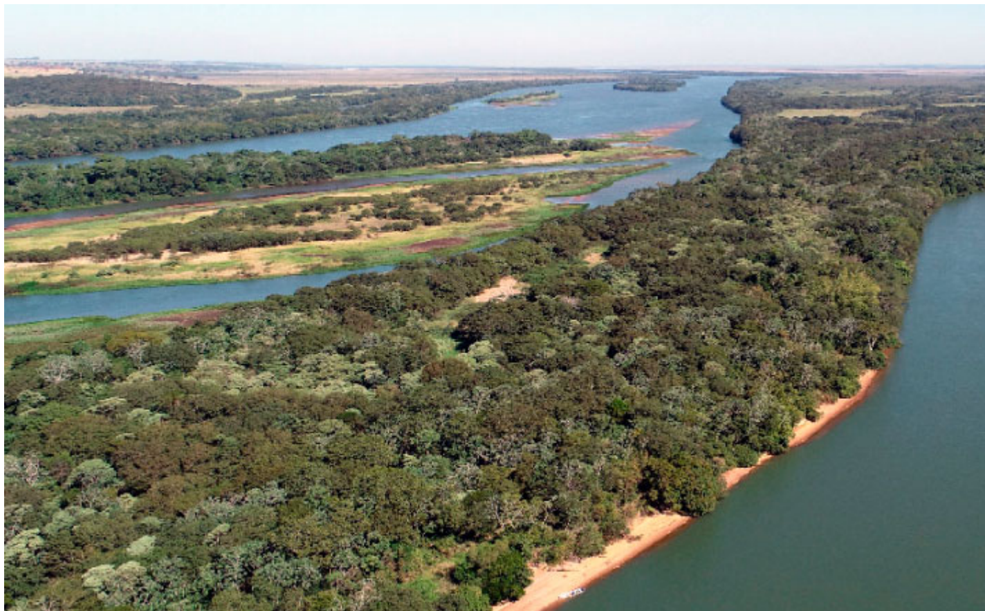
Parque Nacional de Ilha Grande