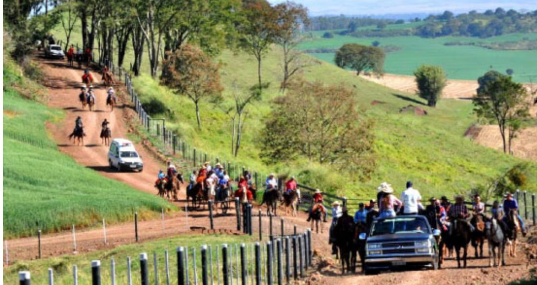
Cavalgada do Padroeiro