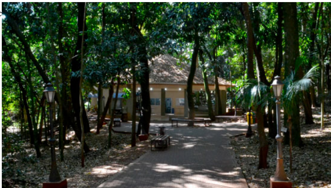
Bosque Municipal Afonso Junqueira Franco