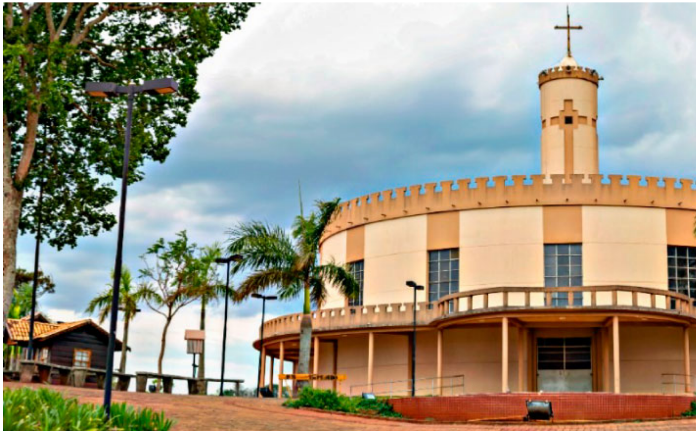
Paróquia São Pedro Apóstolo - Foto: Prefeitura de São Pedro do Ivaí