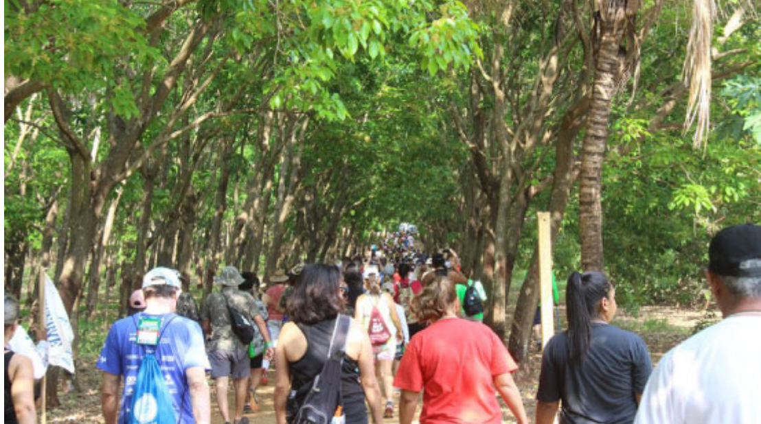
Caminhada na Natureza - Foto: Prefeitura de Itaguajé