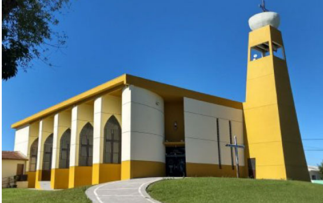
Paróquia Matriz São Carlos Borromeu