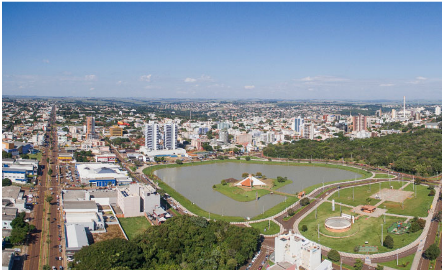
Parque Ecológico Diva Paim Barth