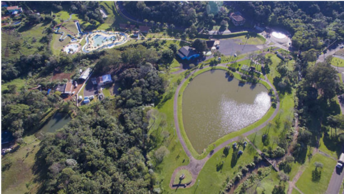
Parque dos Pioneiros