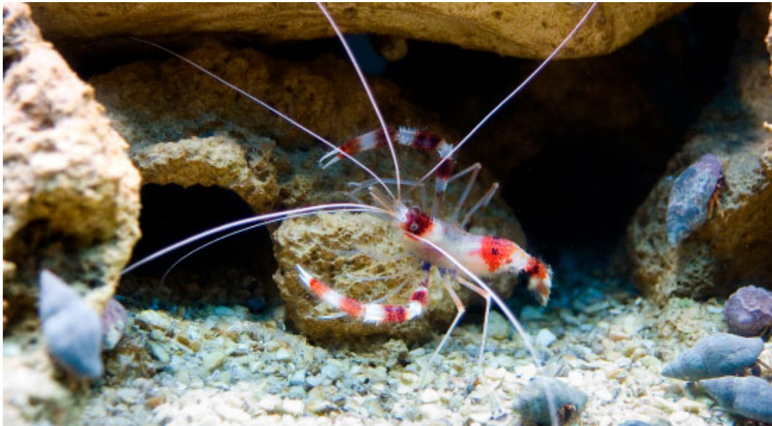
Aquário Municipal Dr. Romolo Martinelli