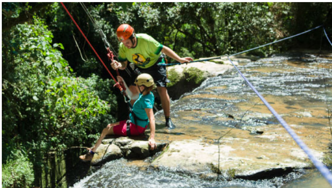
Ninho do Corvo