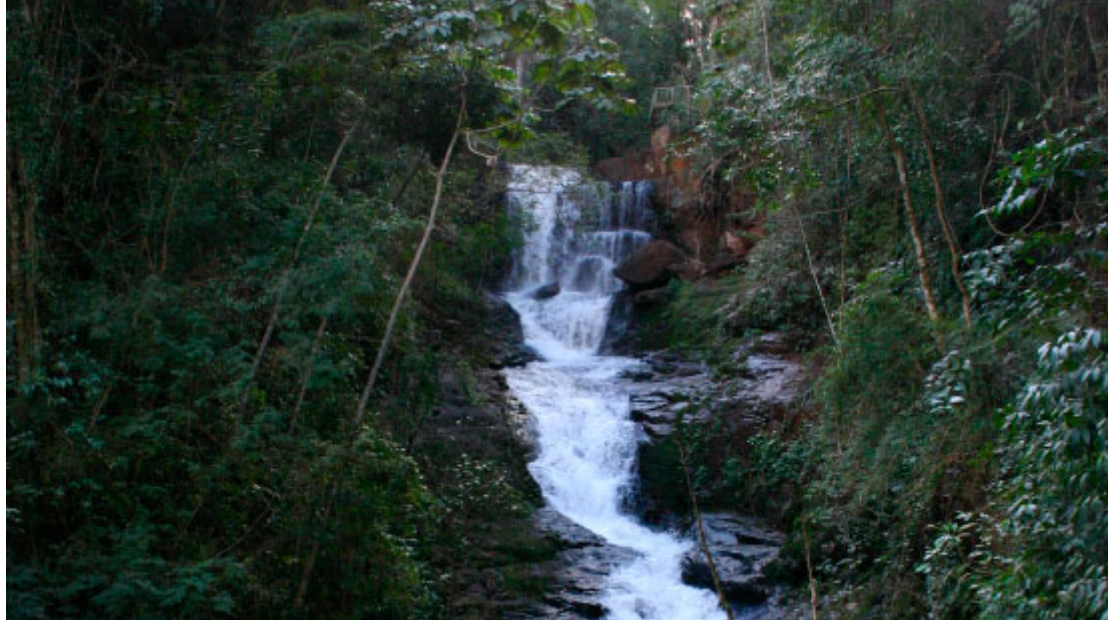
Parque Arthur Thomas