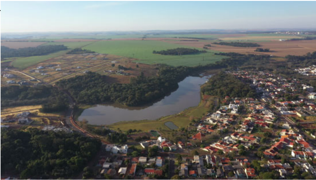
Parque do Lago