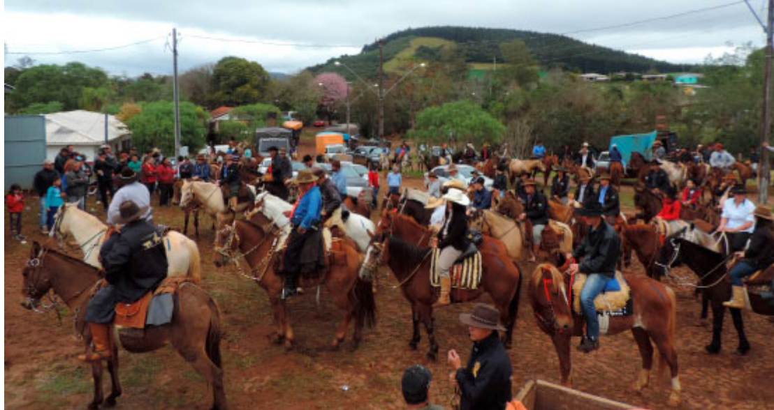
Cavalgada da Integração