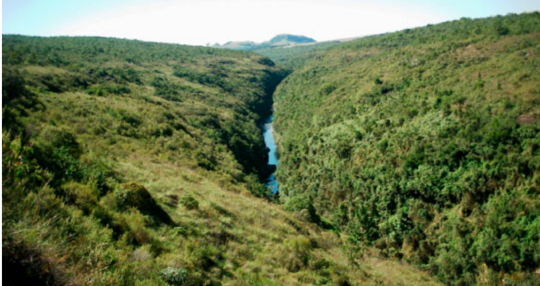
Cânion do Rio Jaguariaíva