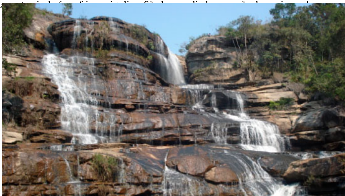
Parque Estadual do Cerrado

Jaguariaíva possui locais de belezas exuberantes. O Parque Municipal do Cerrado, destinado às atividades de ecoturismo, educação ambiental e pesquisa; o Parque Estadual do Vale do Codó que possui paredões de 20 a 60 metros de altura e diversas espécies de animais; e o Parque Estadual Lago azul, que há três cachoeiras e piscinas.