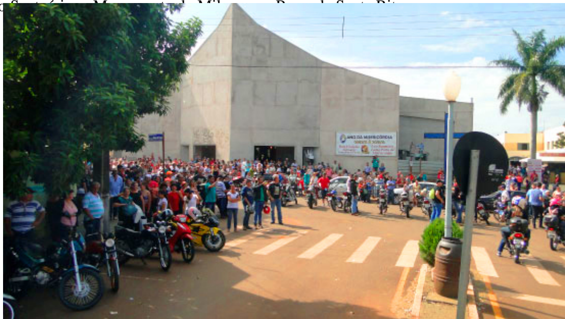
Santuário Santa Rita de Cássia

Todos os domingos milhares de fiéis e devotos chegam para visitar a cidade e passear pela gruta de Santa Rita, o Santuário Mãe de Mil. Devido ao grande número de visitantes, a Prefeitura de Lunardelli