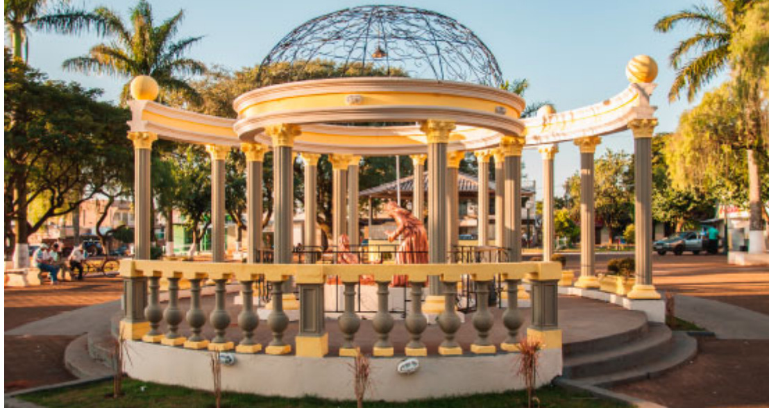
Monumento da Rosa