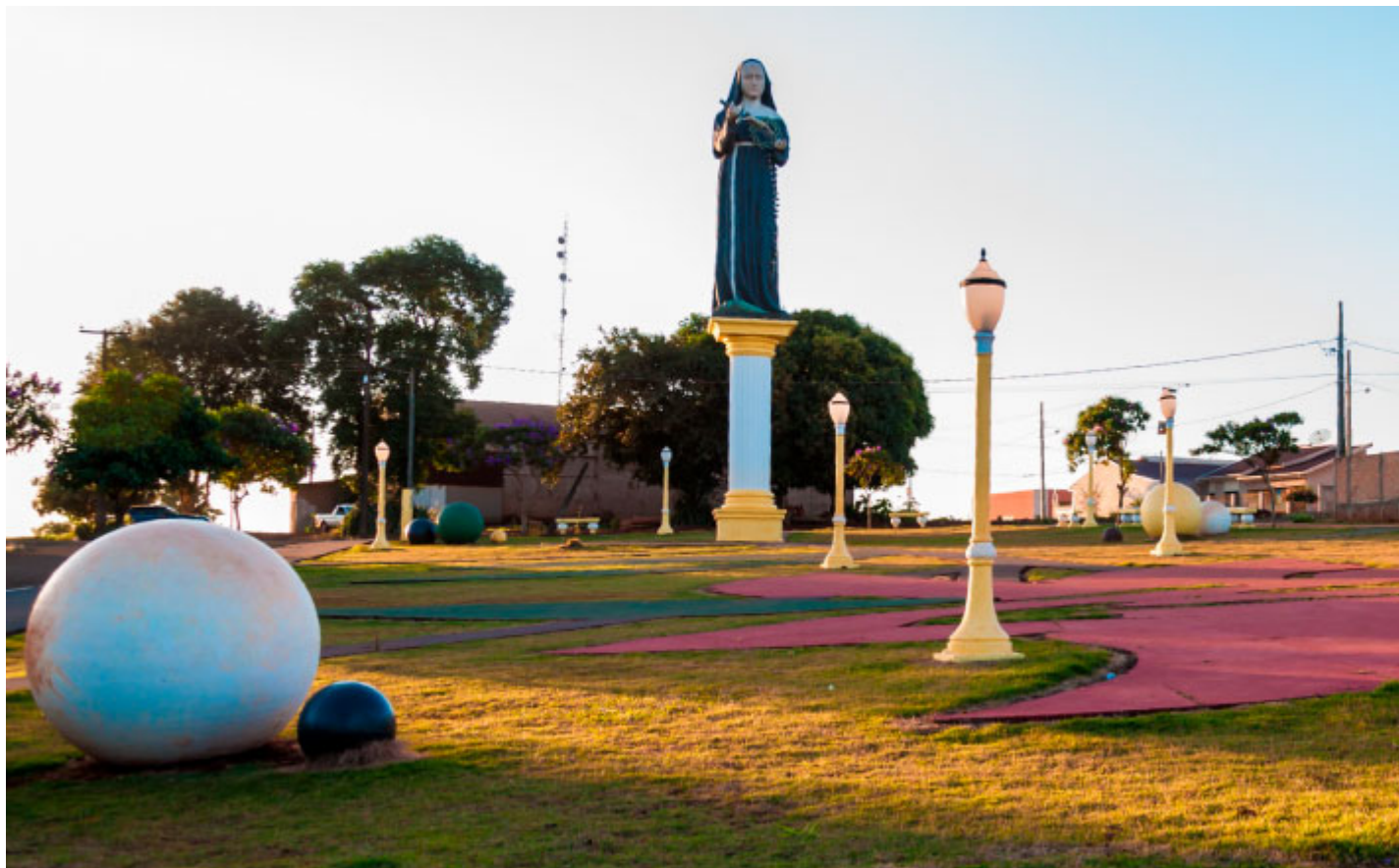
Praça de Santa Rita