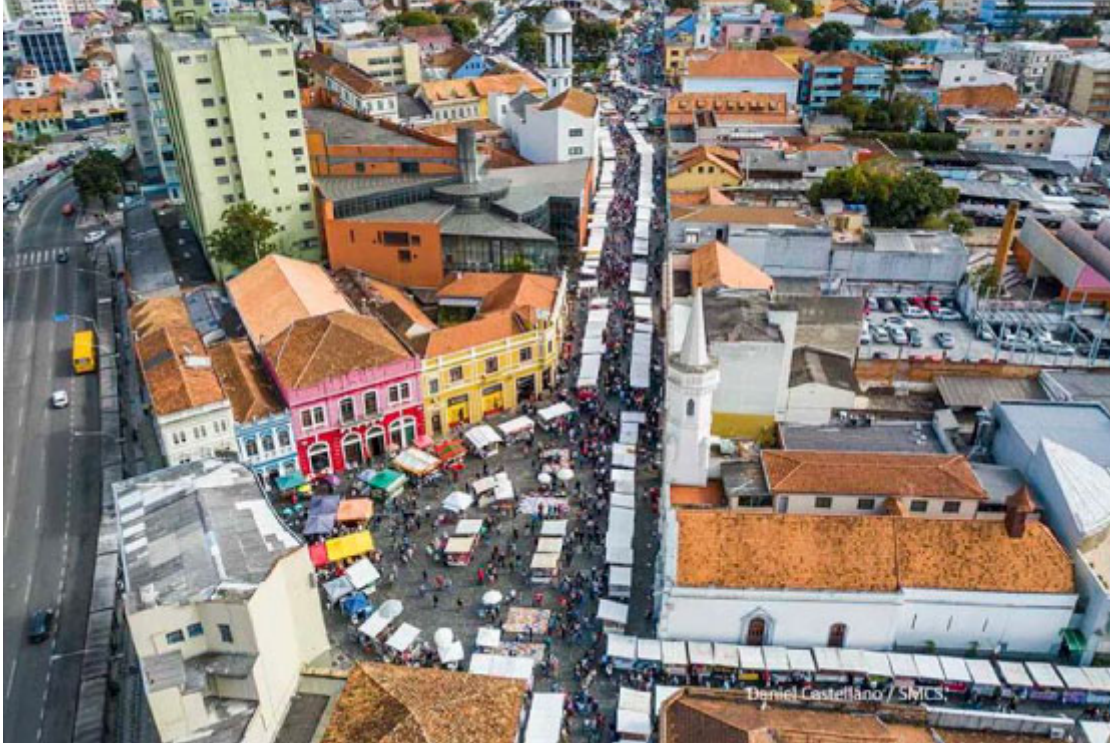
Feira do Largo da Ordem - Foto: Daniel Castellano