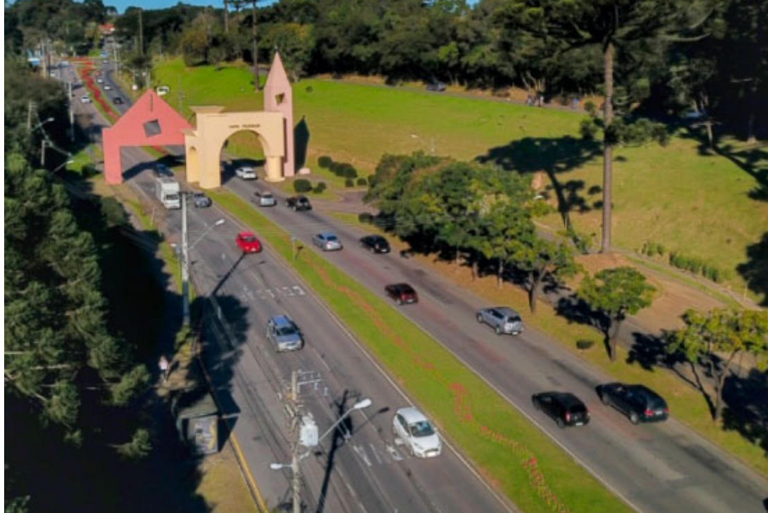
Portal de Santa Felicidade