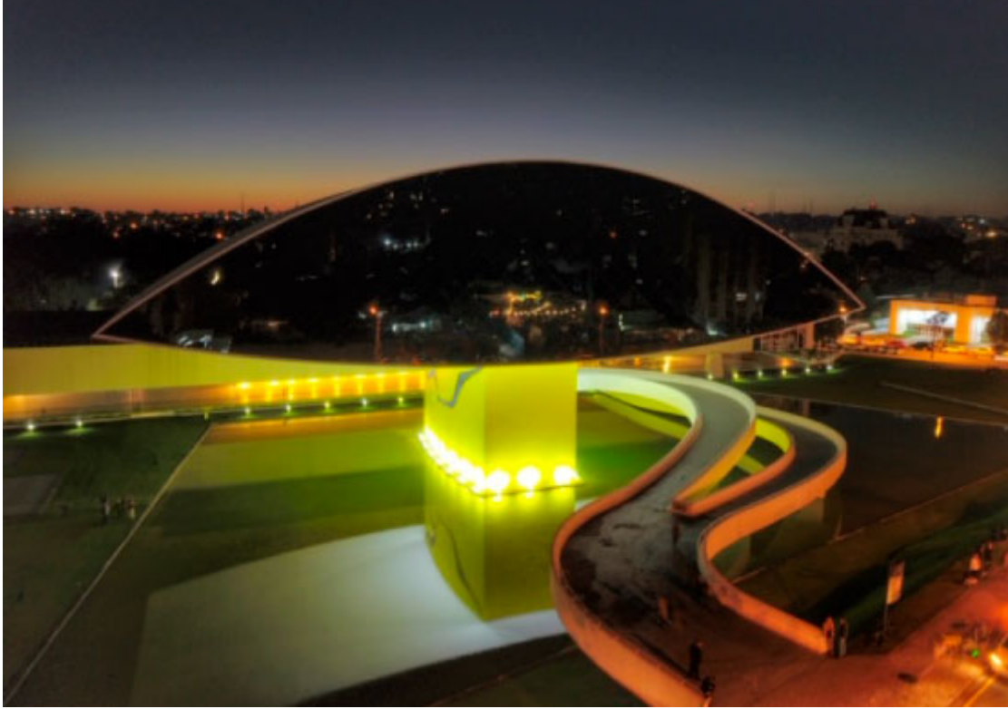
Museu Oscar Niemeyer