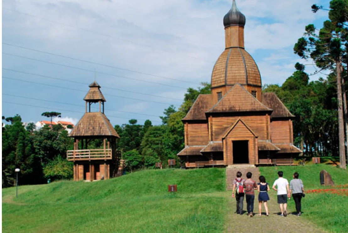
Memorial Ucraniano no Parque Tingui - Foto: Banco de Imagens