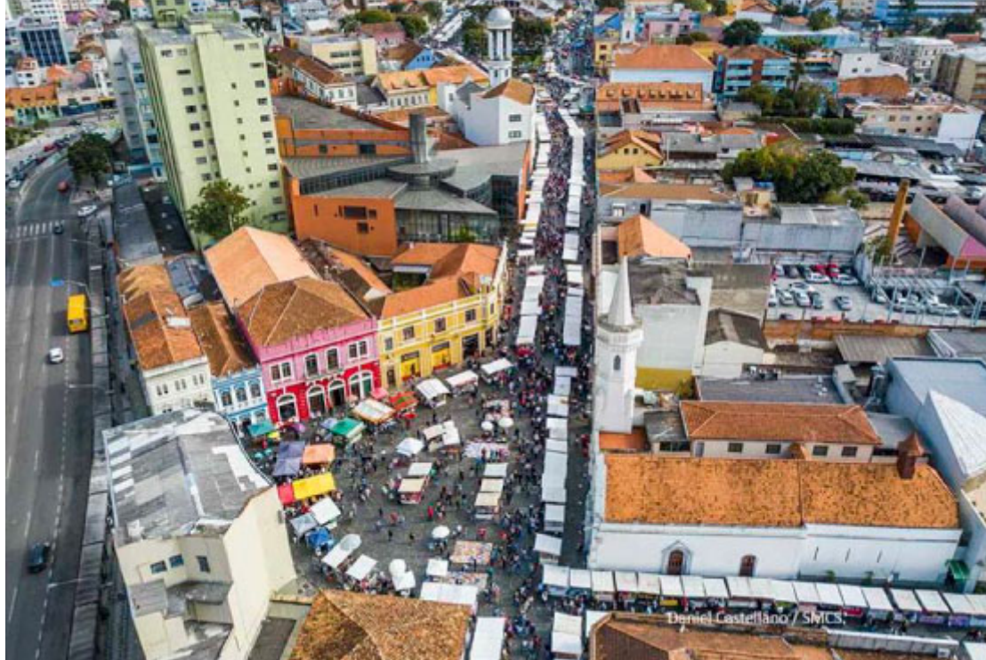
Feira do Largo da Ordem