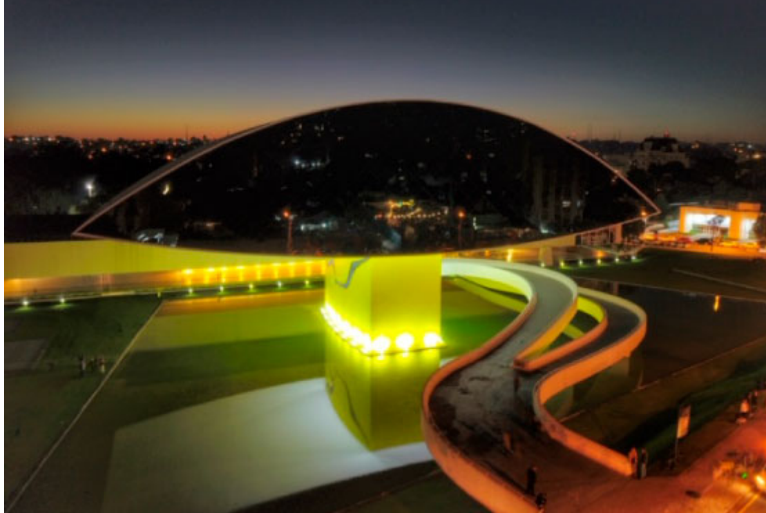
Museu Oscar Niemeyer