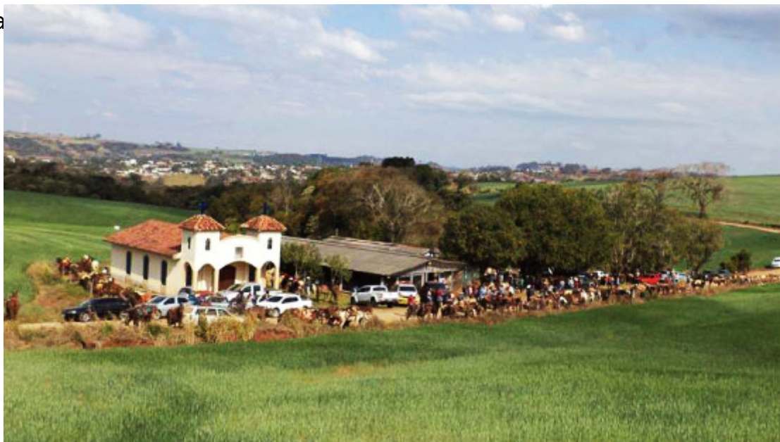
Capela Santa Luzia

Dentre as festividades do aniversário de Iretama, comemorado no dia 25 de julho, a cavalgada já é tradicional. O local de concentração é na Capela Santa Luzia