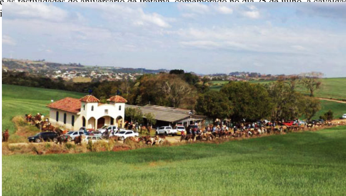
Capela Santa Luzia

Dentre as festividades do aniversário de Iretama, comemorado no dia 25 de julho, a cavalgada já é tradição