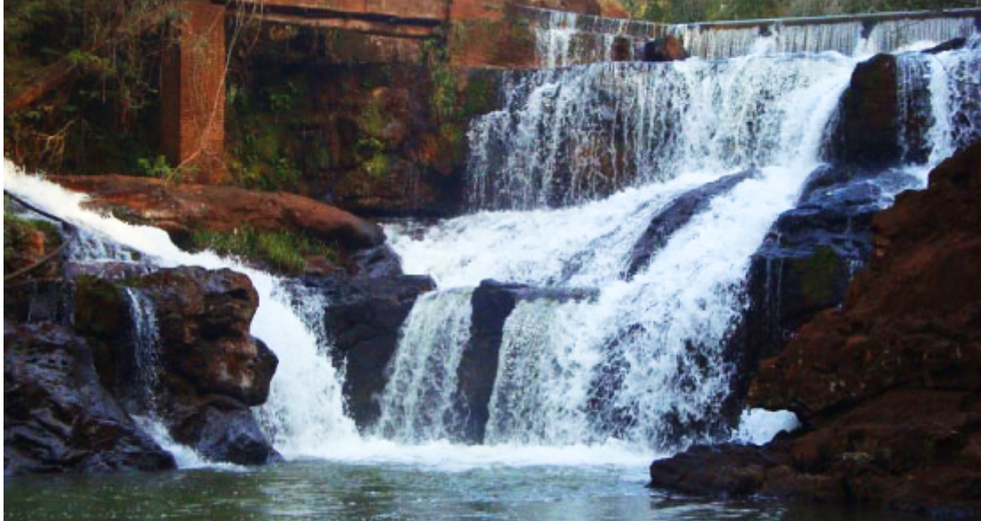
Cachoeira do Bicão