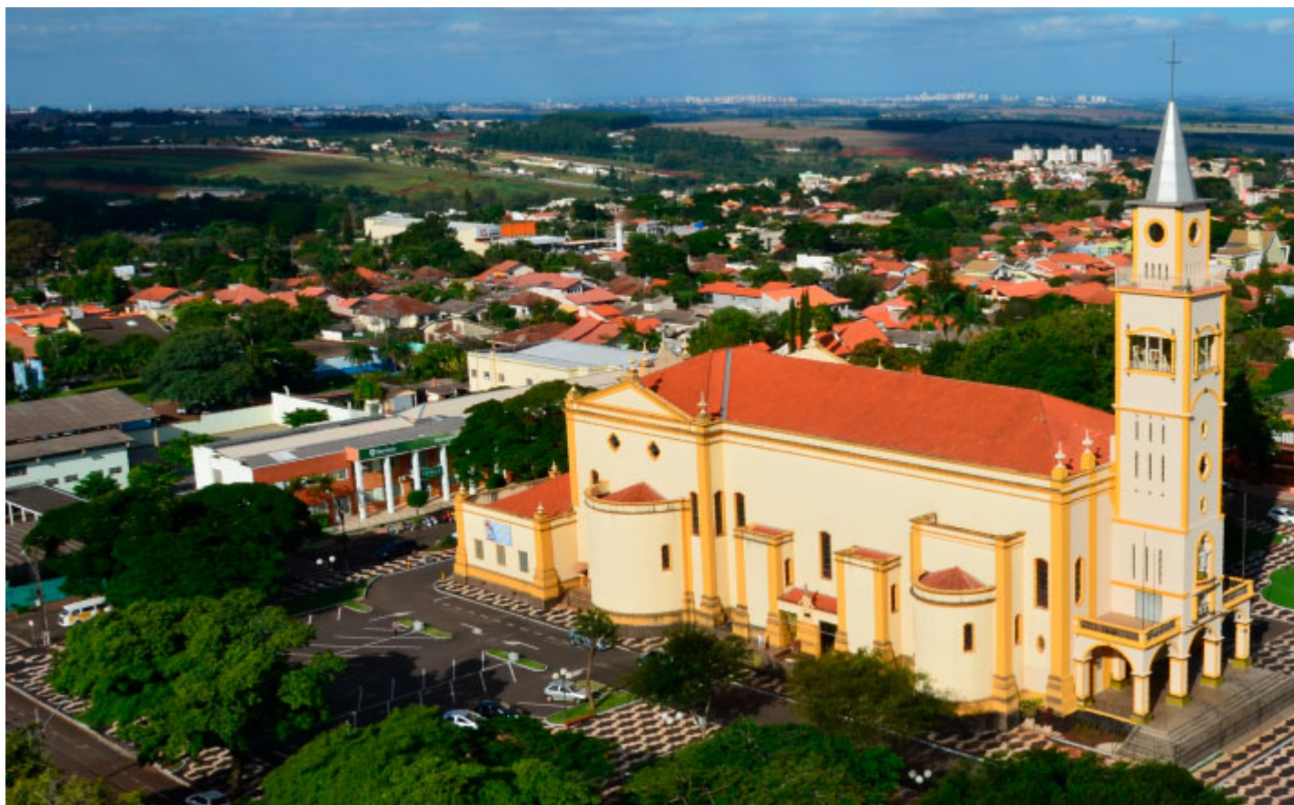
Igreja Matriz - Foto: Paulo Usso / Prefeitura de Rolândia