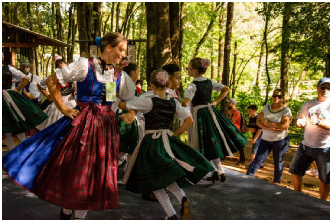
Via Rural da Expo Londrina