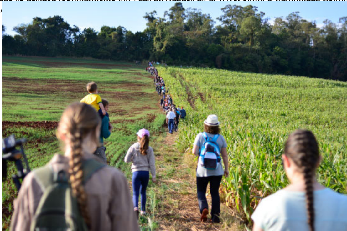
Caminhada Ecológica de Rolândia - Foto: Gean Soares / Prefeitura de Rolândia

A cidade se destaca regionalmente por suas atividades ao ar livre, como a Caminhada Ecológica de Rolândia