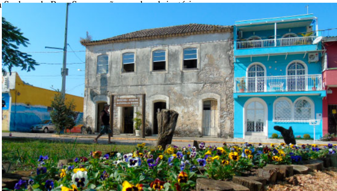
Casarão do Porto

Arte, cultura e história também são contempladas no município. Seja para conhecer mais da história local ou apenas para apreciar belas obras da arquitetura, o Casarão do Porto, o Centro Histórico e a Igreja Matriz Nossa Senhora do Rosário são pontos de interesse.