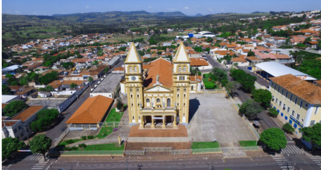
Catedral Diocesana de Jacarezinho - Foto: Guilherme Melo / Prefeitura de Jacarezinho