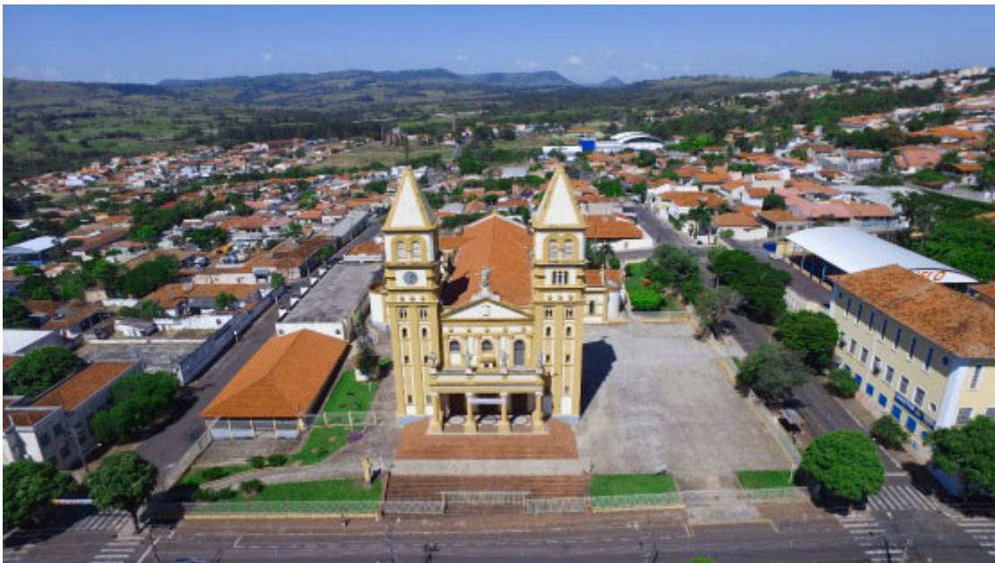
Catedral Diocesana de Jacarezinho