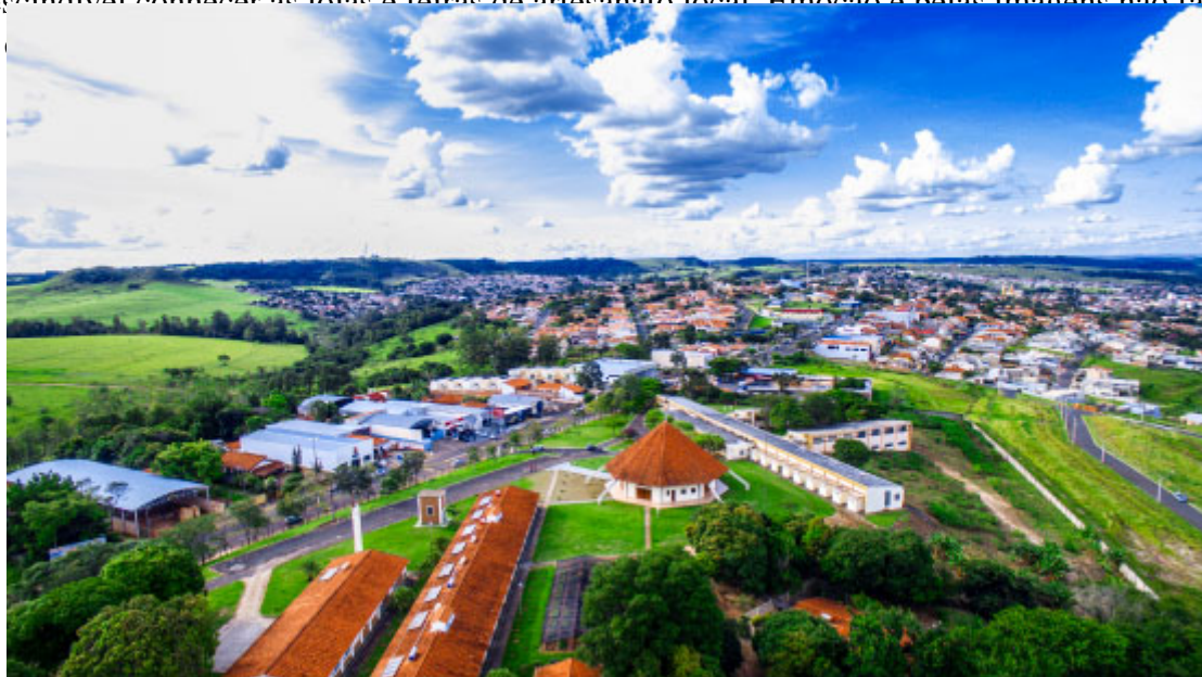
Santuário Nossa Senhora de Guadalupe

de Teatro (CAT). E para aqueles que não voltam para casa sem levar uma lembrancinha na bagagem, é imprescindível conhecer as lojas e feiras de artesanato local. Emoção e belas imagens não faltarão a quem visita