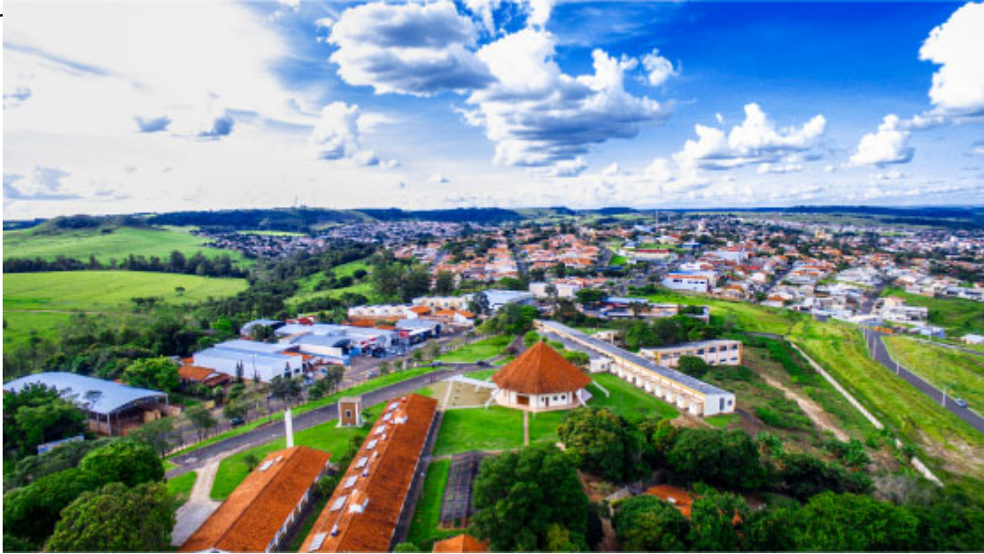
Santuário Nossa Senhora de Guadalupe

tendo como palco das apresentações o tradicional Conjunto Amadores de Teatro (CAT). E para aqueles que não voltam para casa sem levar uma lembrancinha na bagagem, é imprescindível conhecer as lojas e feiras de artesanato local. Emoção e belas imagens não faltarão a quem visita essa cidade com opções diver