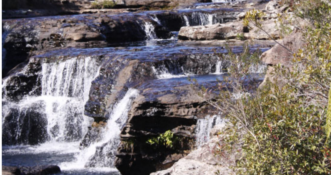
Rio Tamanduá - Foto: Prefeitura de Balsa Nova