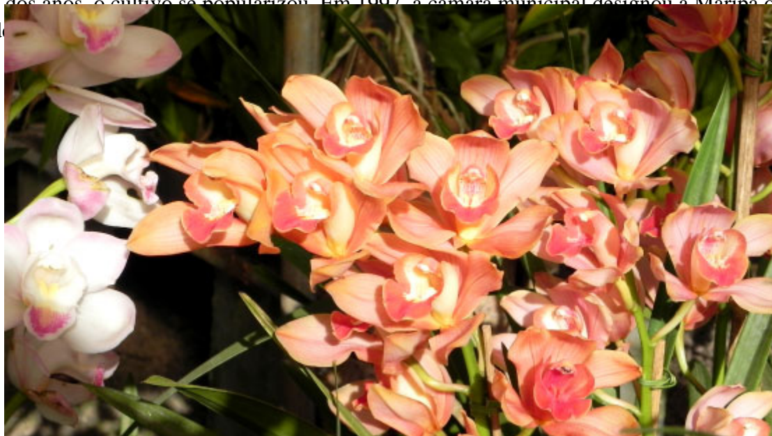
Orquidário Arte Flores