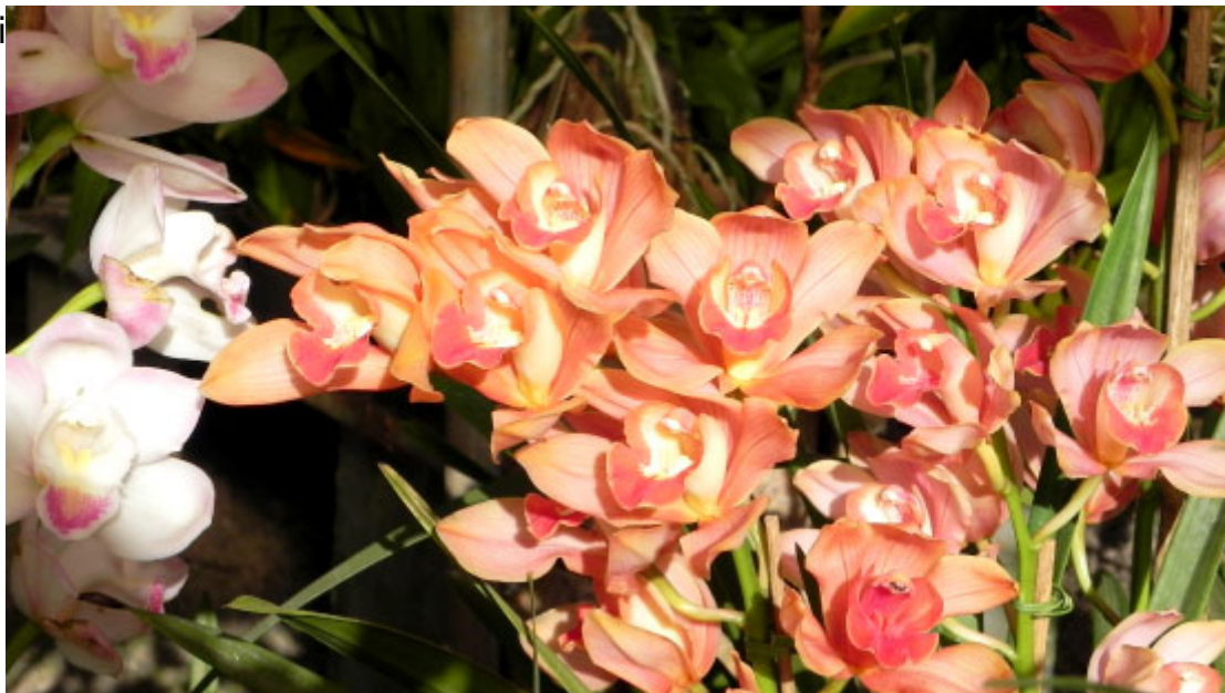
Orquidário Arte Flores