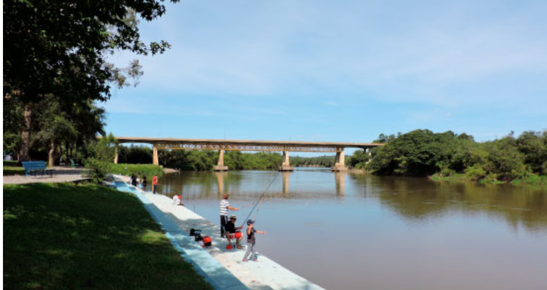
Praça Rio Iguaçu