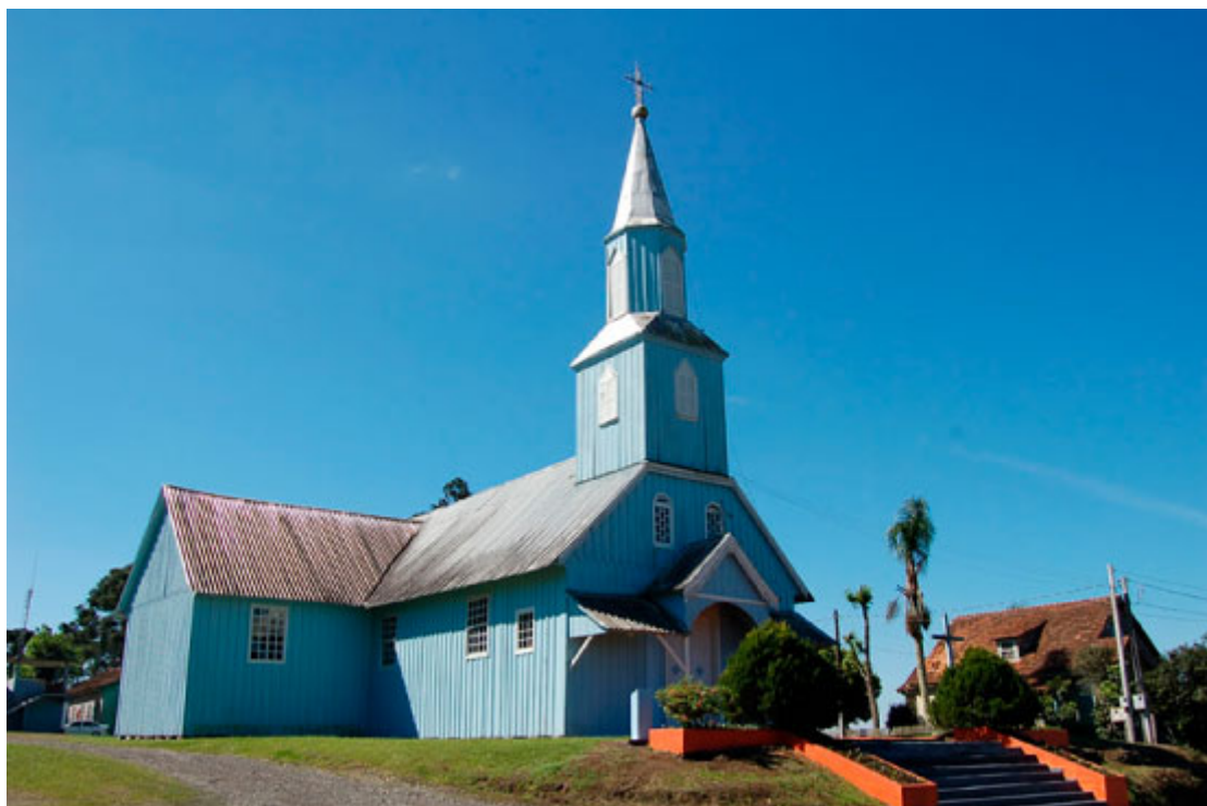
Igreja Centenária da Água Branca - Foto: Alexandre Müller / Prefeitura de São Mateus do Sul