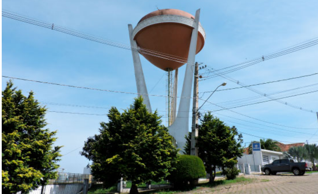
Caixa d'água em forma de Cuia - Foto: Alexandre Müller / Prefeitura de São Mateus do Sul