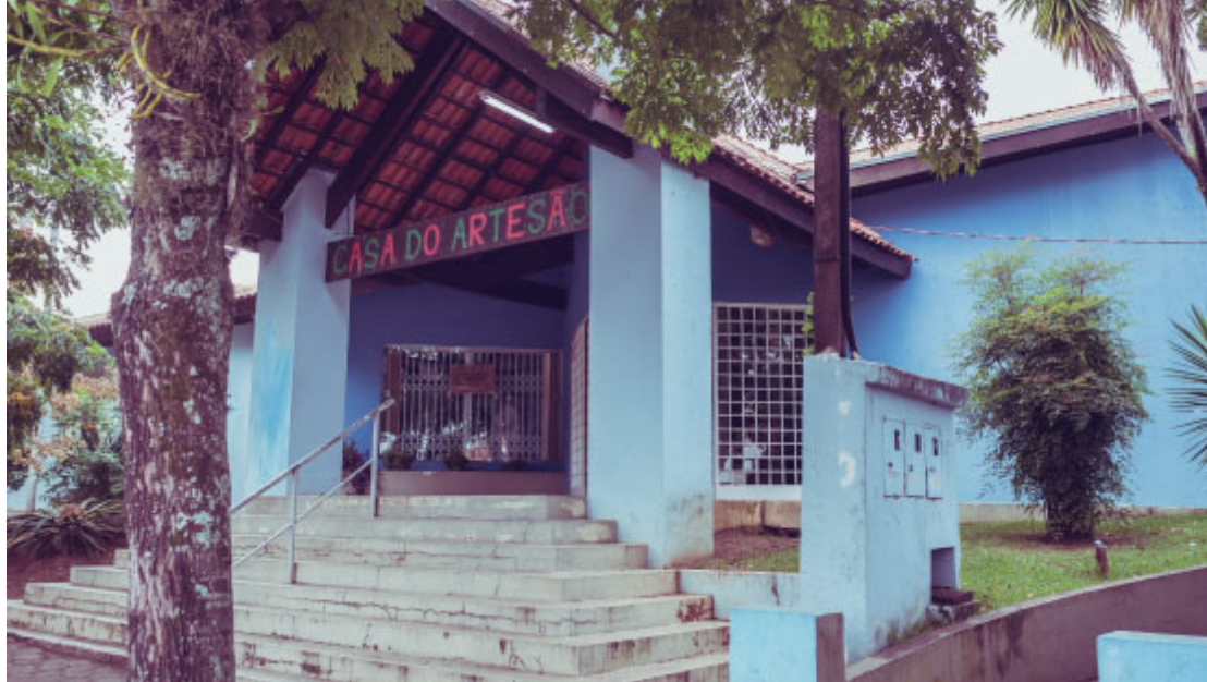
Casa do Artesão